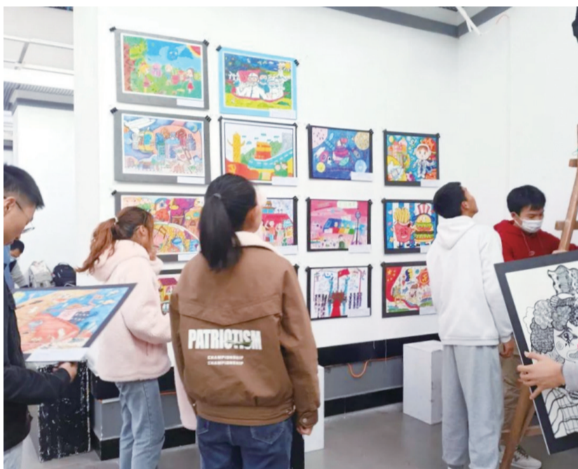
工作人员和志愿者们将书画作品进行有序排版、挂置、摆放。