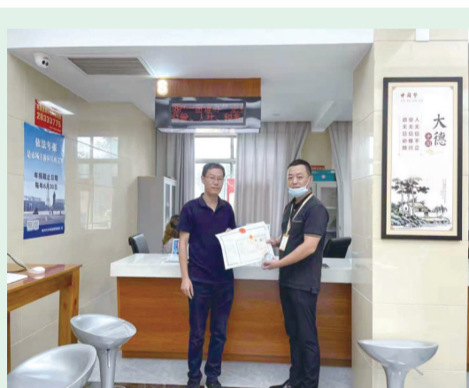
企业开办“一窗通办”提供自选套餐服务