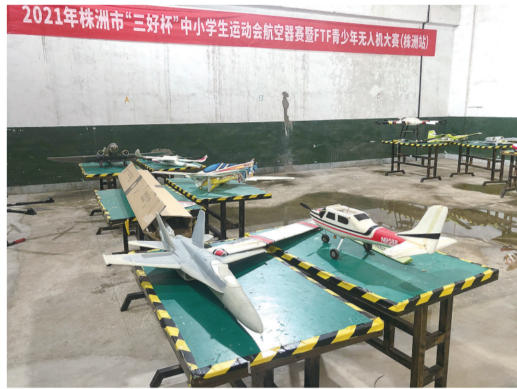
老厂房变成产品展示中心。

株洲日报·掌上株洲讯(记者/周嵩) 261家企业搬离清水塘,曾经的老厂房,部分已经拆除,有的将作为工业遗址在改造后予以保留,还有一些闲置的老厂房将怎么办?