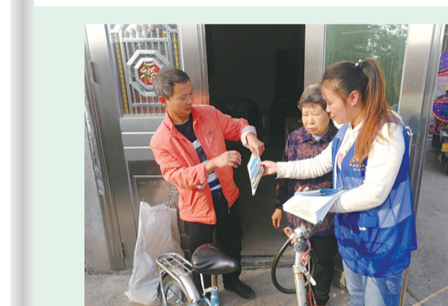
每位网格员都是一个群众身边移动的便民服务窗口