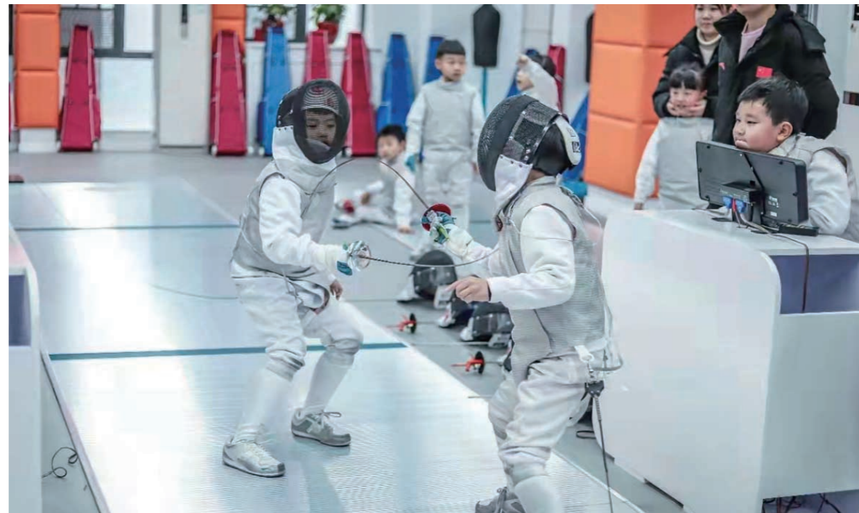
▲湖南翎羽国际击剑中心场馆里,青少年学员在练习。通讯员 供图

在日常生活中,热爱运动、增强体育锻炼的意识早已深入人心。除了跑步、游泳、打羽毛球等大众体育项目外,在消费升级浪潮下,体育消费也向个性化转变,尤其射箭、击剑等一些传统小众运动项目开始“复兴”,深受当下很多年轻人的喜爱,有望成为体育消费“新势力”。