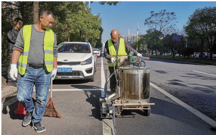
▲珠江北路美的城附近路段增设停车位。

随着城区道路临时停车位二期、三期建设的不断推进,以及本月底将进行收费管理听证,道路停车再次引起市民关注。为何要增设道路临时停车位?今后停车会有哪些便利?记者就此进行了采访。