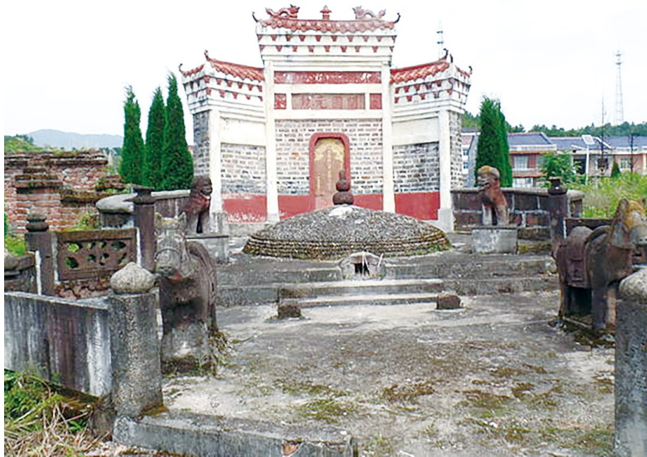
石陵村的刘三吾墓,2011年被公布为湖南省文物保护单位。