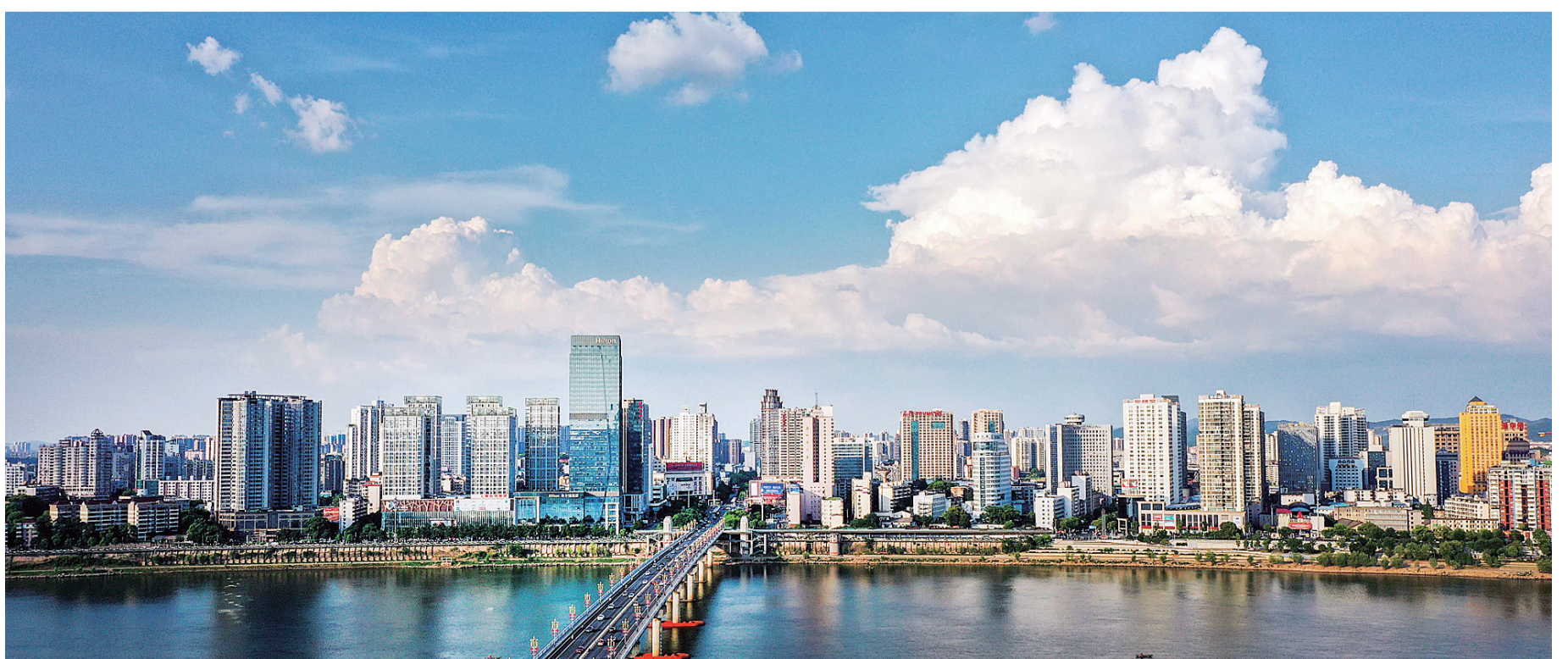
城市上空,蓝蓝的天空飘着白云。