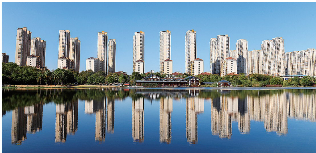
栗雨公园,蓝天与高楼倒映在湖中。