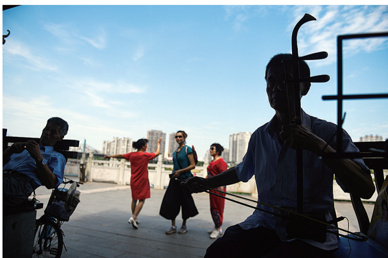
尽情享受生活之美。