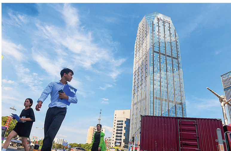
城市上班族的回眸一望。

人不负青山,青山定不负人。人们明显感受到株洲的蓝天白云天数越来越多,空气也越来越清新,“株洲蓝”已经成为幸福株洲的一张新名片。