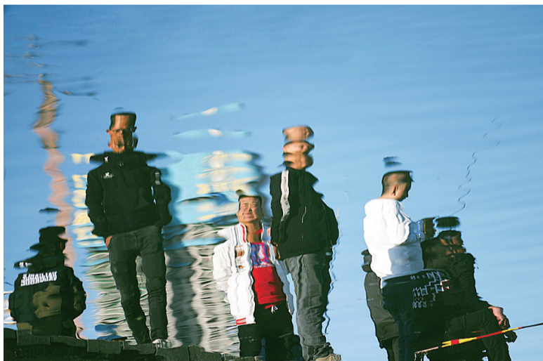
江面的倒影里,观看钓鱼的人们。