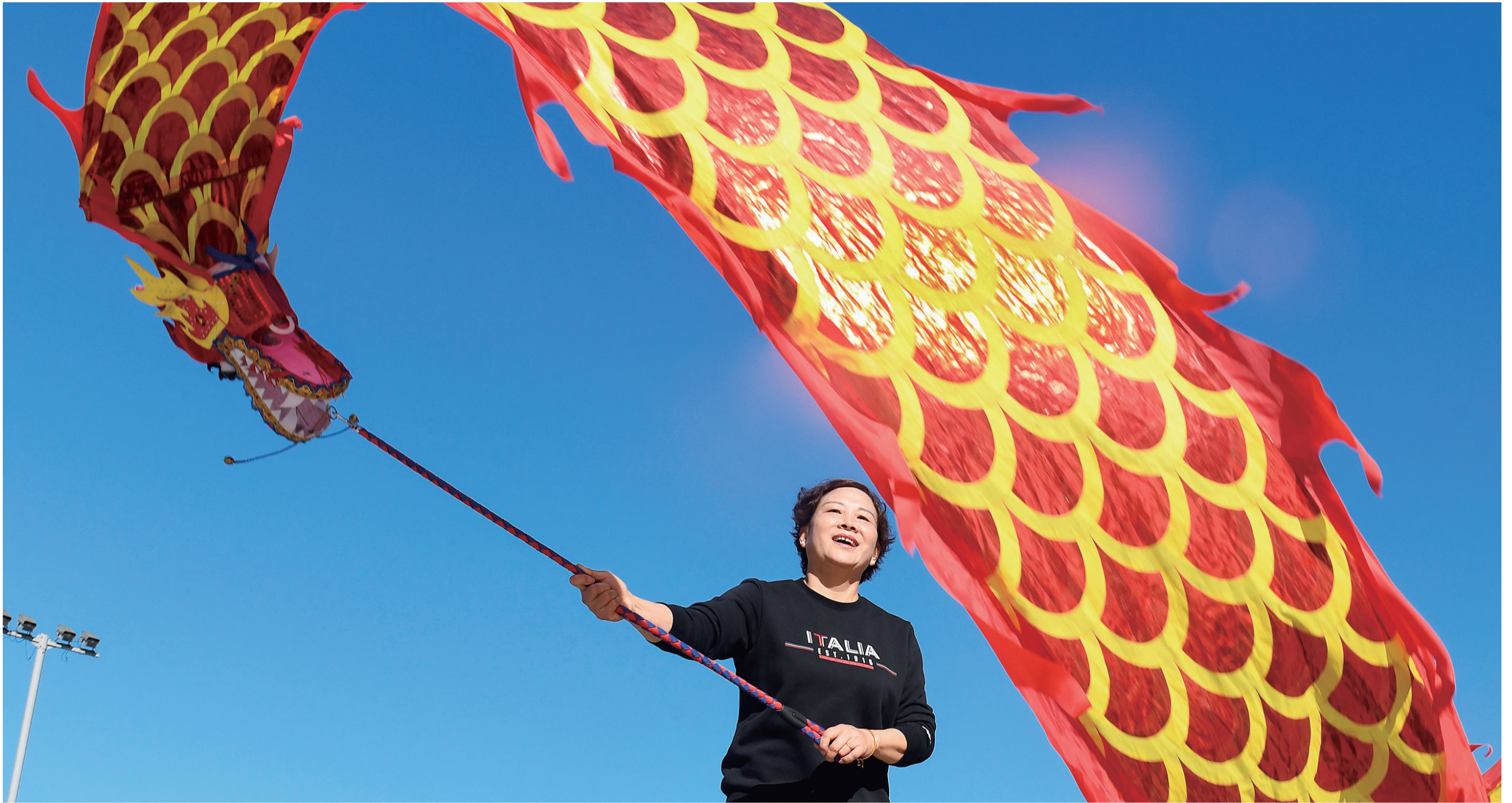
珠江北路,晴朗的天气里,市民快乐地挥舞手中的彩龙。