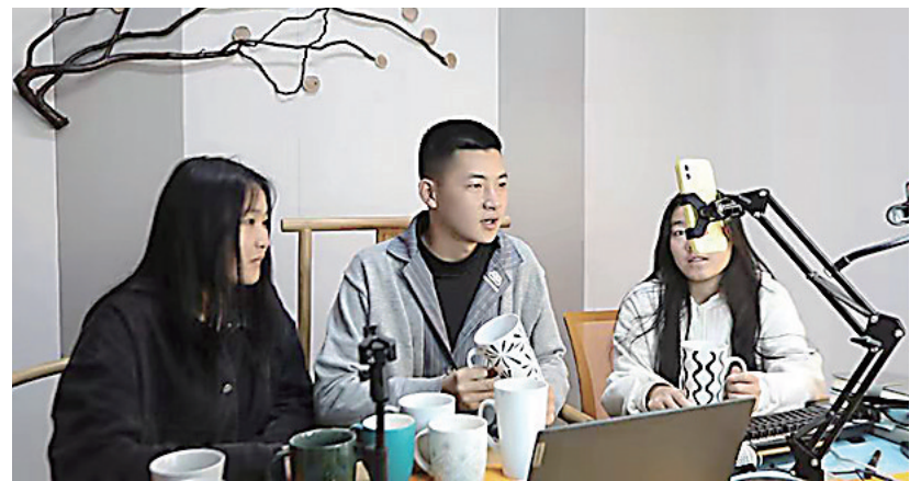
主播们在醴瓷直播基地直播带货。

作为旨在帮助中小创业者实现“零门槛”创业的平台,该基地还推出了入驻第一季度水、电、租金全免的优惠政策,计划通过组织直播培训、策划交流、主题沙龙等线下活动,培训一批陶瓷直播带货的本地网红主播,打造一批抖音直播带货标杆号,树立醴瓷电商品牌形象。