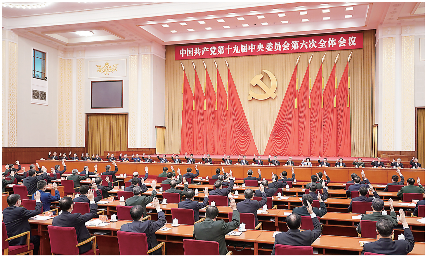
中国共产党第十九届中央委员会第六次全体会议，于2021年11月8日至11日在北京举行。中央政治局主持会议。

新华社北京11月11日电 中国共产党第十九届中央委员会第六次全体会议公报 (2021年11月11日中国共产党第十九届中央委员会第六次全体会议通过) 中国共产党第十九届中央委员会第六次全体会议，于2021年11月8日至11日在北京举行。 出席这次全会的有，中央委员197人，候补中央委员151人。中央纪律检查委员会常务委员会委员和有关方面负责同志列席会议。党的十九大代表中部分基层同志和专家学者也列席会议。 全会由中央政治局主持。中央委员会总书记习近平作了重要讲话。 全会听取和讨论了习近平受中央政治局委托作的工作报告，审议通过了《中共中央关于党的百年奋斗重大成就和历史经验的决议》，审议通过了《关于召开党的第二十次全国代表大会的决议》。习近平就《中共中央关于党的百年奋斗重大成就和历史经验的决议(讨论稿)》向全会作了说明。 全会充分肯定党的十九届五中全会以来中央政治局的工作。一致认为，一年来，世界百年未有之大变局和新冠肺炎疫情全球大流行交织影响，外部环境更趋复杂严峻，国内新冠肺炎疫情防控和经济社会发展各项任务极为繁重艰巨。中央政治局高举中国特色社会主义伟大旗帜，坚持以马克思列宁主义、毛泽东思想、邓小平理论、“三个代表”重要思想、科学发展观、习近平新时代中国特色社会主义思想为指导，全面贯彻党的十九大和十九届二中、三中、四中、五中全会精神，统筹推进国内国际两个大局，统筹推进疫情防控和经济社会发展，统筹发展和安全，坚持稳中求进工作总基调，全面贯彻新发展理念，加快构建新发展格局，经济保持较好发展态势，科技自立自强积极推进，改革开放不断深化，脱贫攻坚如期打赢，民生保障有效改善，社会大局保持稳定，国防和军队现代化扎实推进，中国特色大国外交全面推进，党史学