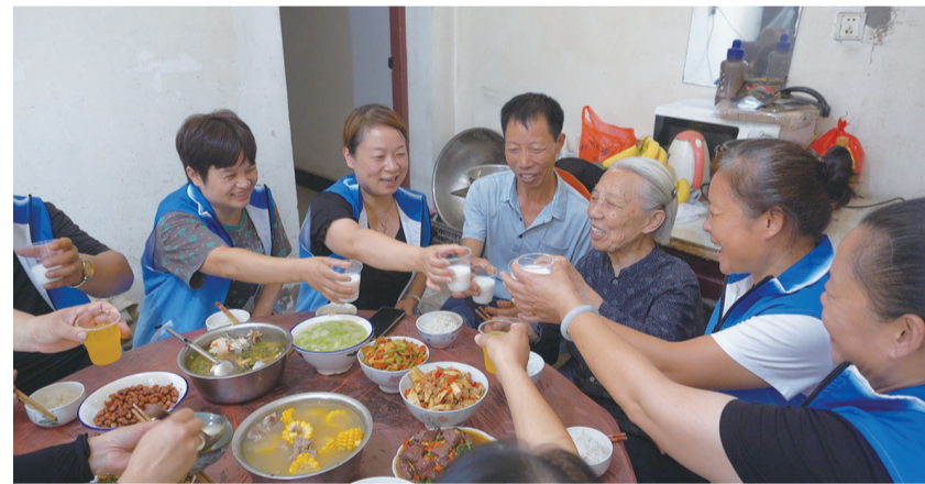
志愿者们照顾社区空巢老人。

微纪录片《力量》,用朴实的镜头和文字,记录了天元区许许多多的小故事,叙述了天元区委区政府坚持以人民为中心,不断充实和完善群众路线内涵,厚植民本情怀,践行为民初心。制作:谭清云 周婧 李翰 黄婷婷 吴梦洁 楚洋