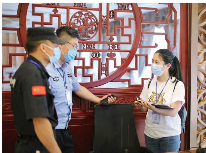
株洲日报记者在采访现场。