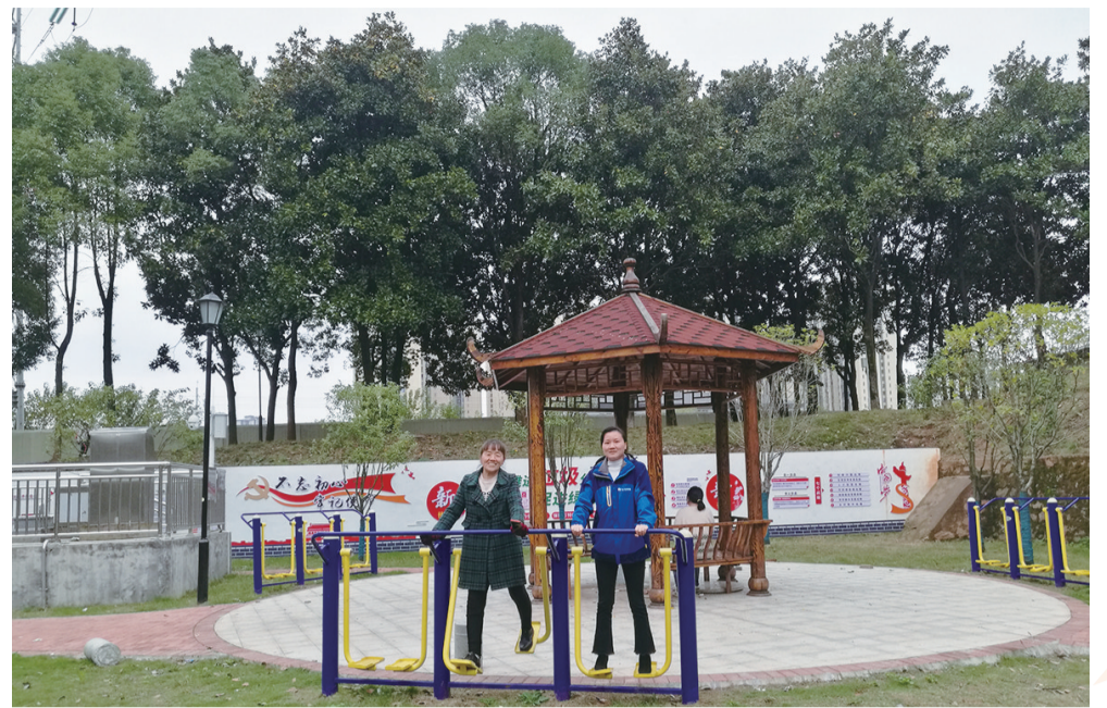
火炬小区小游园,居民在健身休闲。

阵地设施完善,服务也不落下。小区党支部成立后,对居民服务需求进行全面走访了解,建立工作台账,发挥党支部直接联系服务群众的义务,积极推行“在职党员当先锋,服务群众办实事”活动,发动在职党员到小区党支部报到,推动党员亮身份亮承诺,引导党员在小区管理中当标兵、做模范。同时,设立党群议事厅,制定党群议事会制度,每月定期召开会议,集中商讨社区居民关心的热点、难点问题,让居民群众有话可以讲、有意见可以提,社区事情大家有商有量。