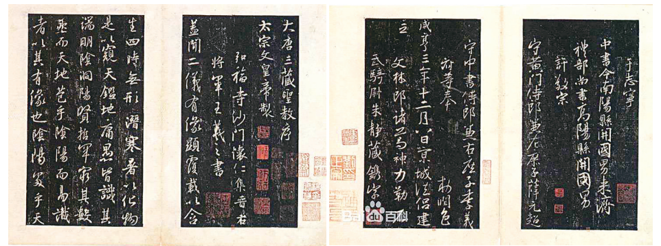
怀仁集王羲之字《大唐三藏圣教序碑》帖