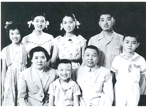
谭震林夫妇和他们的六个子女