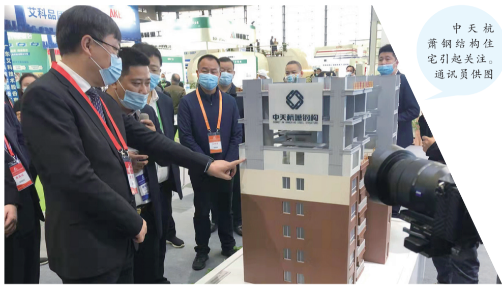
中天杭萧钢结构住宅引起关注。通讯员供图

究中心。 “随着国家‘3060’双碳目标的提出,建筑领域节能降碳已成为行业发展的趋势。我们力求通过研发推广第五代建筑,促进建筑产业转型升级,助力国家实现碳达峰、碳中和,同时满足人民群众更高品质生活的需求。”伟大集团相关负责人介绍。