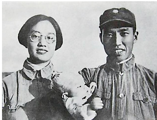
左权将军与夫人刘志兰及女儿的合影

常言道,家书抵万金。特别是在血与火的战争年代里的家书更是显得弥足珍贵。 早一向去山西,拜谒了醴陵籍高级将领左权将军烈士陵园,我印象最深的便是左权将军的一封封家书。左权将军仅存的十余封家书中,既有讲述自己革命志愿的,又有对红色中国的憧憬与希冀;既有缠绵火热的儿女情长,又有寄予后辈的殷切期望。 拜读将军家书,仿佛触摸到那个血与火的苦难时代,从而感悟到抗战英雄的人格魅力。