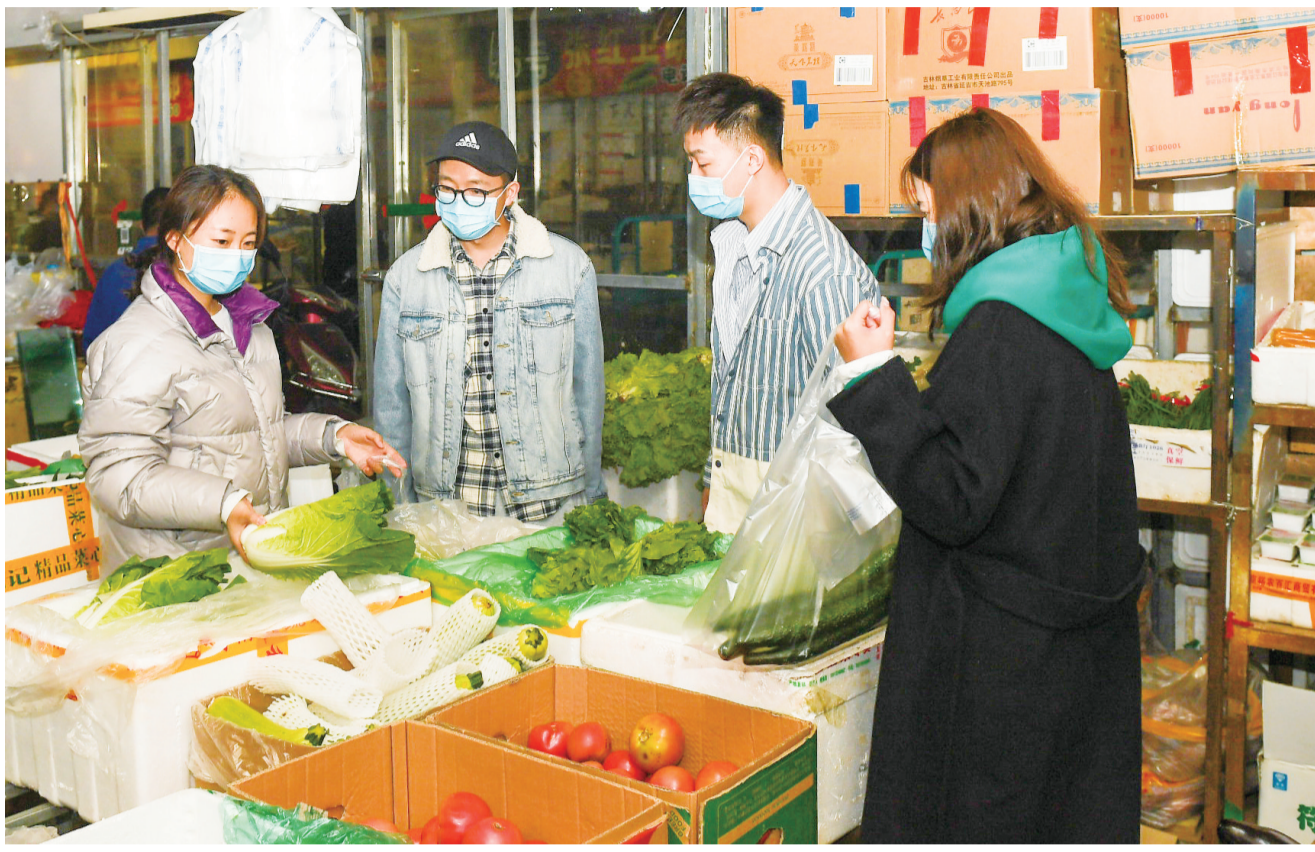
10月24日,在呼和浩特市万惠农贸批发市场,市民在采购蔬菜。近日,内蒙古呼和浩特市协调大型农产品批发市场、超市、物流配送企业,加大民生物资调运和配送能力,保障市场供应。

新华社北京10月24日电 近期,国内出现多点散发本土疫情,扩散风险仍在加大。新一轮疫情的处置情况如何?疫苗加强针怎么打?秋冬季疫情防控有哪些注意事项?国务院联防联控机制新闻发布会24日就公众关心的问题集中做出回应。