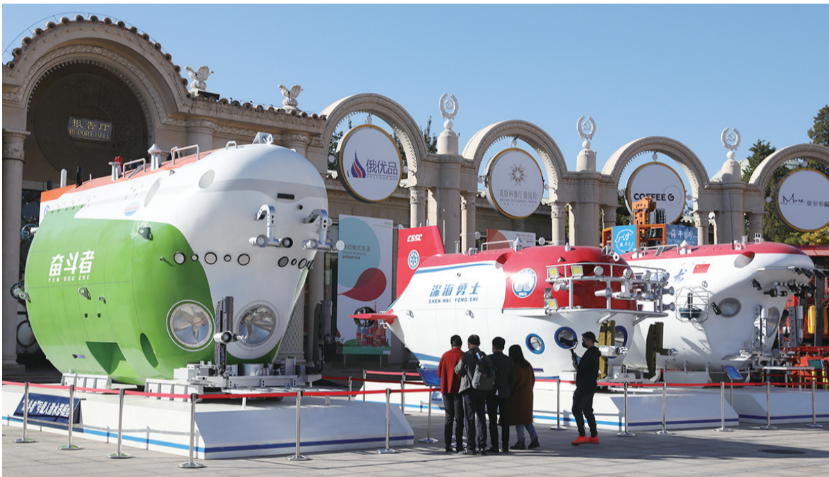
10月21日，观众在北京展览馆参观科技创新成就展展出的载人潜水器。

新华社北京10月21日电 经过半年多紧张筹备，国家“十三五”科技创新成就展21日正式开幕，系统呈现创新型国家建设重大进展，尽显科技魅力，展现创新为人类美好生活带来的强劲动力。 本次展览以“创新驱动发展 迈向科技强国”为主题，既有基础前沿、科技重大专项、战略高技术、社会民生、农业农村科技创新方面取得的重大成果，也展示了区域创新、科技体制改革、科技人才队伍建设、