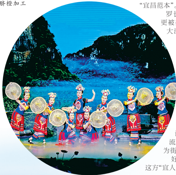
▶清江流域首部室内歌舞剧《花咚咚的姐》