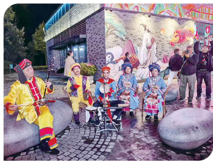
▲三峡非遗in巷的巴风古韵