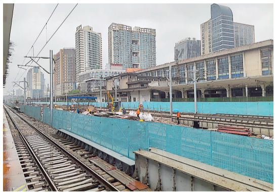
正在施工中的3站台。