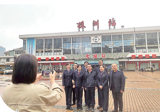
株洲火车站工作人员与车站合影留念。