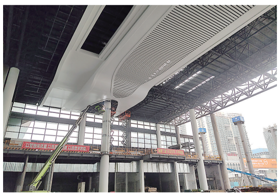
株洲火车站东站房内部,装修样板区正在进行装修施工。