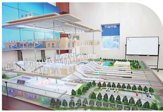
株洲火车站东站房透视图。

“停办客运,对市民出行肯定会有影响。但一时的不便,是为了给株洲一个更好的火车站。”他说。