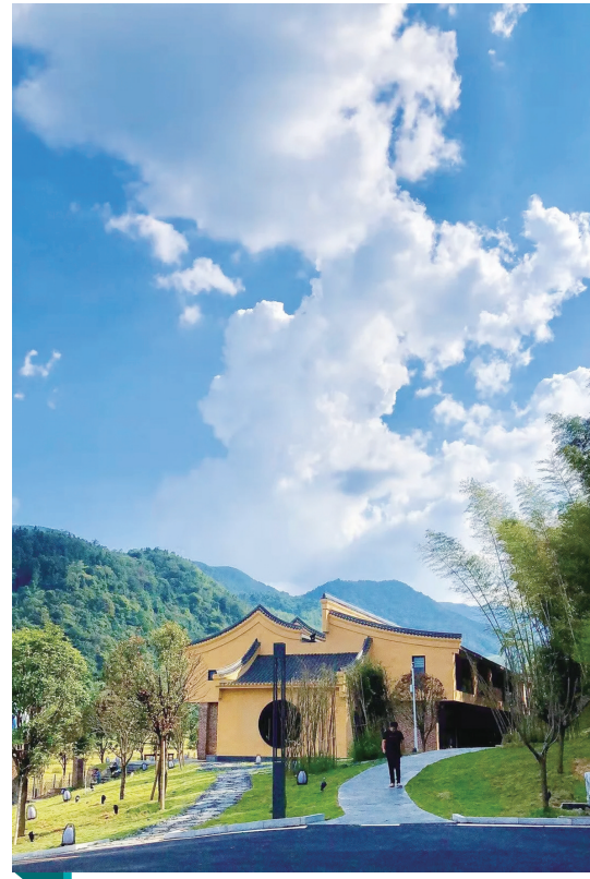
桃源山居外景。

如今，该公司已发展茶园面积1450亩，年产优质红茶20余吨，产品畅销，并多次荣获全国名优茶评比奖项。