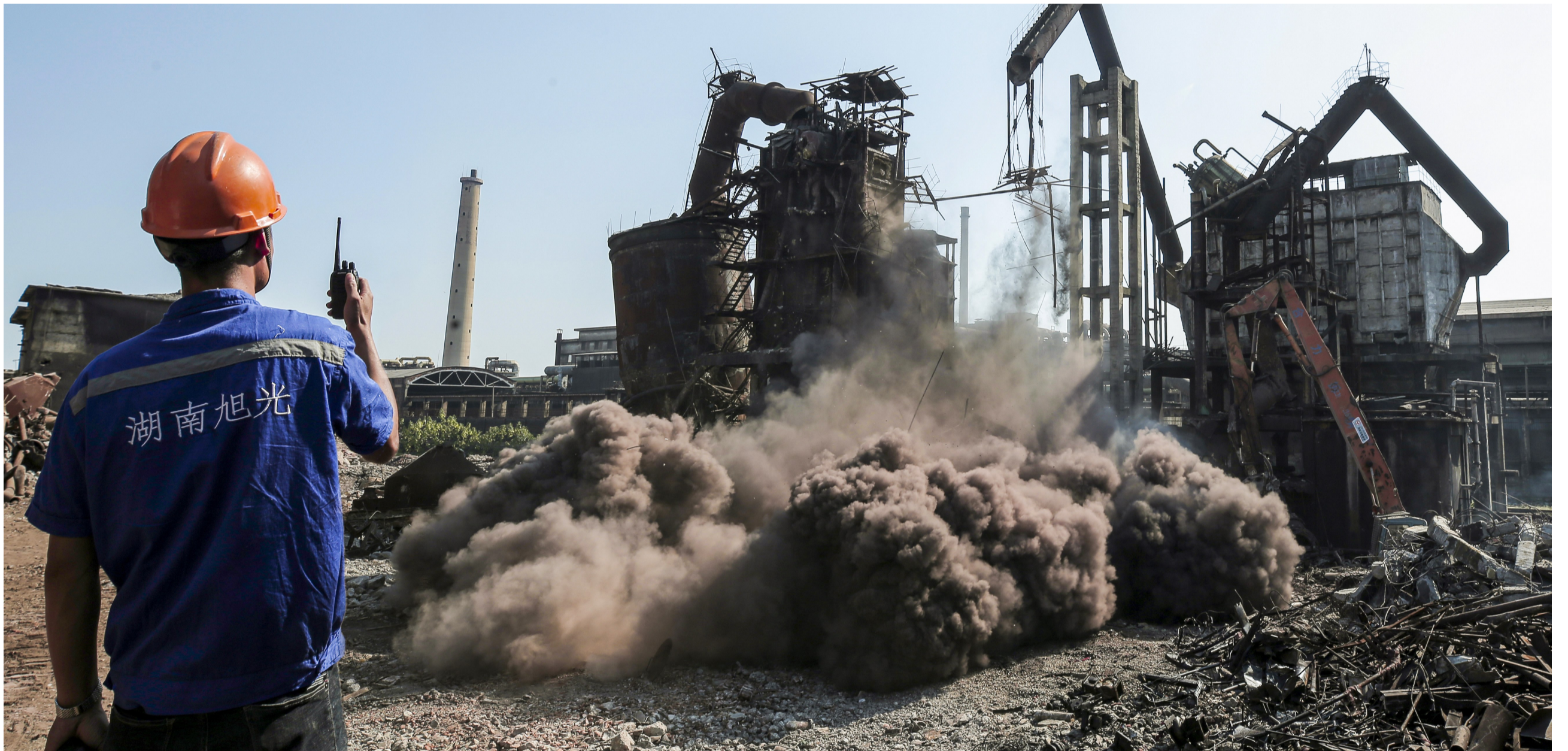
中盐株化(原株洲化工厂)沸腾炉拆除。