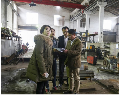
搬迁改造工作人员进行现场资产评估。