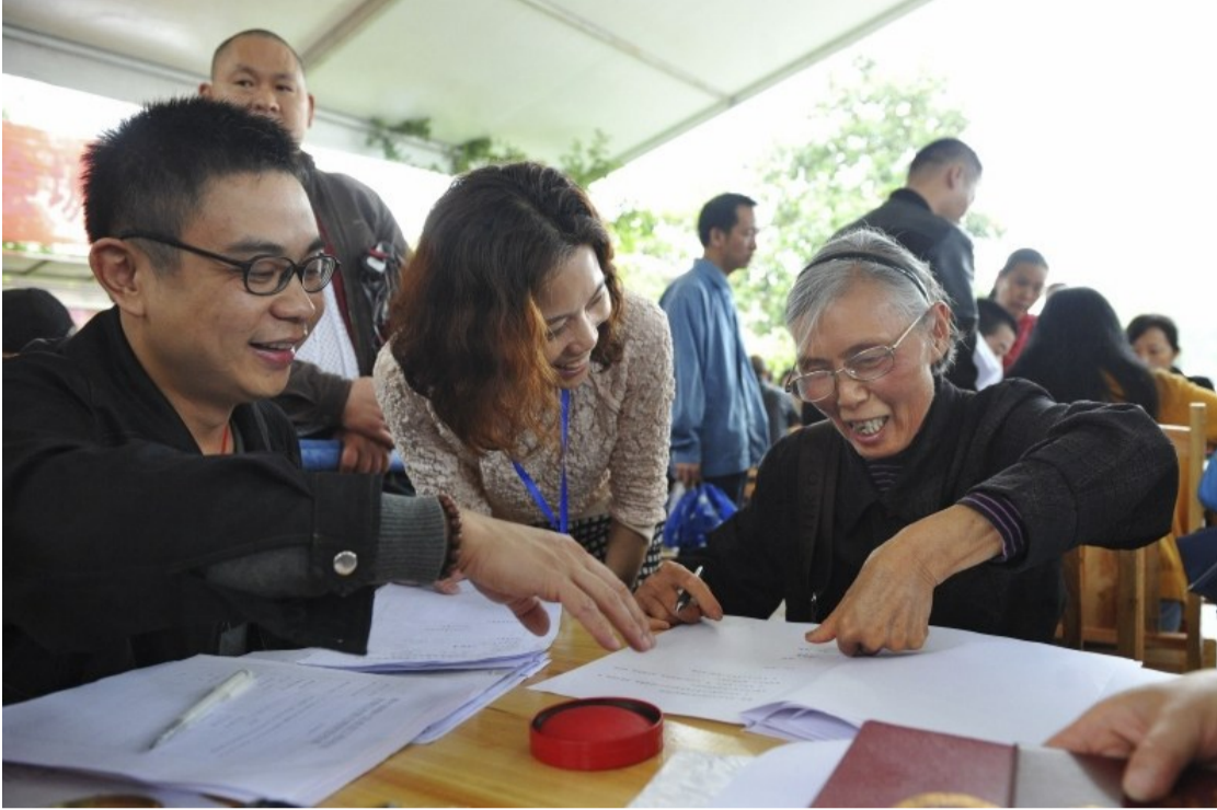
棚改片区居民集中签约。