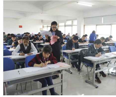
老工业区下岗职工再就业培训。