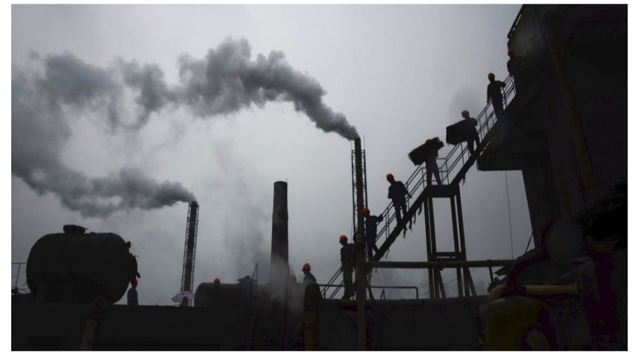
清水塘老工业区曾是株洲最大污染源。

同时,株洲积极争取中央和省的支持,同步推进污染治理。自2010年来,已累计投入28亿元,开展了区域内水系、历史遗留固废渣治理及污染土壤治理修复。2018年,治理后的清水塘整体退出重金属污染重点防控区,湘江株洲段水质持续保持或优于国家Ⅱ类标准。城区空气质量也明显好转,“蓝天300天”的目标已经实现。