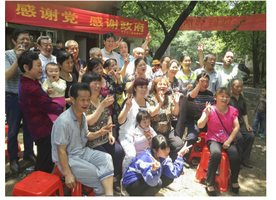
棚户区睦邻餐,老邻居即将搬新家。