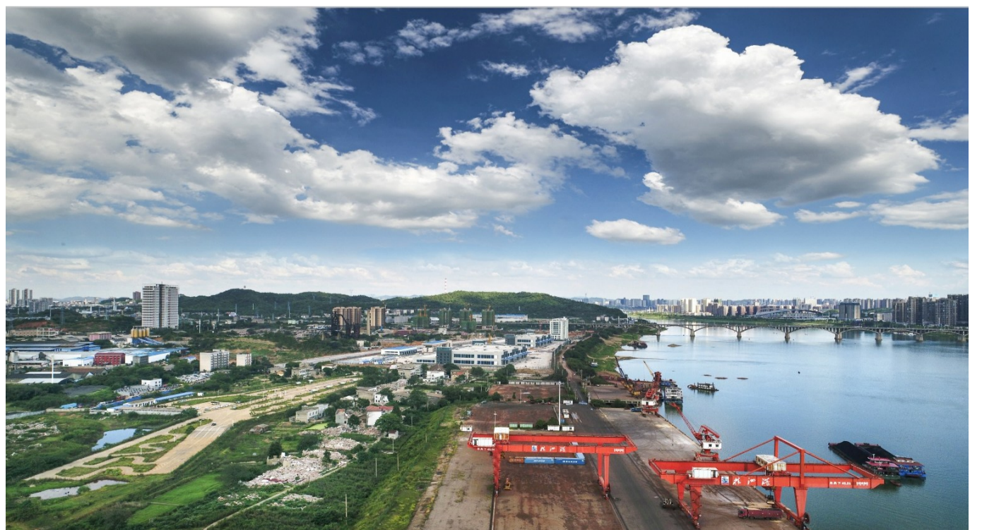
治理后,清水塘段水质得到提升,空气质量也明显好转。

今年,是株洲建市70周年。作为昔日的城市荣耀清水塘工业区,它的建成、发展、转型、新生,无疑最能说明这个城市70年来变化的轨迹和前景。在7月初,本栏目推出了《清水塘蝶变》系列视觉4期,用直观的图片来系统展示老工业基地的涅槃和新生。在连续发出两期后,因突发新冠疫情而中断,10月份续发完成整个系列。4期刊发时间分别为:7月11日第一期《筑梦前行》,7月25日第二期《崛起之初》,10月10日第三期《流金岁月》,10月17日第四期《治理转型》。