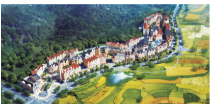
▲青龙湾·奥特莱斯童话小镇整体鸟瞰图。

全株洲只有青龙湾能有低层小洋房! 全青龙湾只有奥莱能有低层小洋房! 青龙湾奥莱小洋房户型以30-60㎡的一房一厅、两房一厅精致小面积为主,总价仅15万-40万元超低门槛,稀缺独特产品既适合创业青年、单身贵族,亦适合离退休生活、健康养老、老小配等多种人群幸福居住需求。