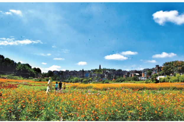
▲小镇万亩花海,在青龙湾享受度假生活。