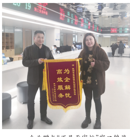
企业赠与“不见面审批”窗口锦旗。