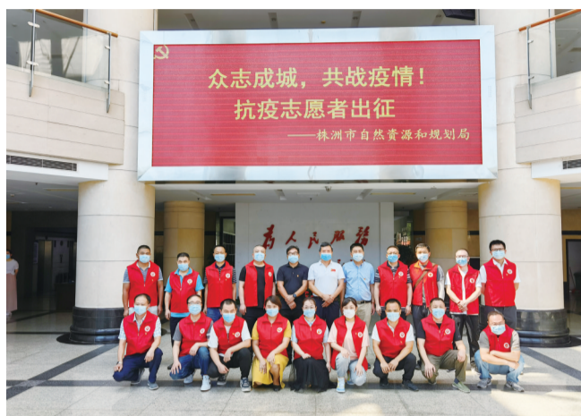
今年8月,资规系统抗疫志愿者出征。受访单位 供图

此外,该局还在局务网上主动公开权力清单、征地拆迁、规划调整、行政处罚等信息,确保社会公众及行政相对人的知情权。近年来,相关部门主动召开各类听证会和协调会上百余次,主动下基层,开展“政策法规进社区”“政策法规进基层”活动,充分听取民声民意。