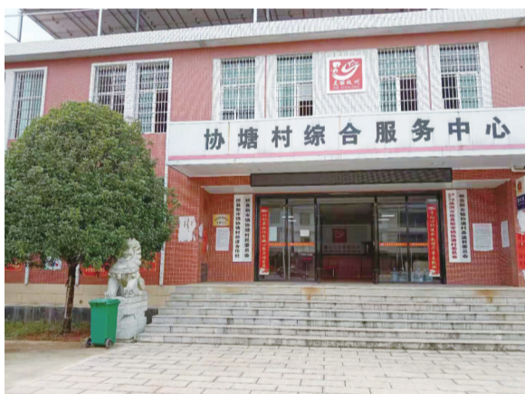
如今的协塘村村委会。

协塘还是个卧虎藏龙之地。协塘之南的牌楼,是清代著名的大才子陈之丕的家乡。国家级突出贡献专家、运八系列飞机总设计师欧阳韶修,也是协塘人。幼时,他常在协塘湖畔边放牛,边看书学习。这些仁人志士的事迹,在当地传为美谈,成为激励年青一代奋发图强的动力。