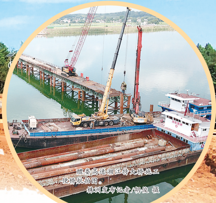
醴陵高速湘江特大桥施工 现场,便桥便道。

醴陵高速各标段全面动工,茶常高速项目征拆全力推进。 一年内,同时开建两条高速公路,开株洲市高速公路建设历史之先河。 东起沪昆,连接京港澳,醴陵高速与京港澳高速、岳临高速、岳汝高速,共同构建起长株潭高速大外环,长株潭都市圈互联互通更快捷,长株潭“半小时交通圈”又有新通道。 跳出长株潭,再看湘赣边:醴陵连接沪昆之后东出连江西,北上争取建设上栗至醴陵高速,连接沪昆江西复线,湘赣交通互联更紧密。 方向正确,奔跑在前,总能与大势和战略合拍。 中国共产党株洲市第十三次代表大会重点提出:聚焦推进长株潭一体化,聚焦建设湘赣边区域合作示范区,交通高速互联是关键。 新起点,新征程。 当好“先行官”,下好“先手棋”,株洲市交通运输局责任上肩,已行在路上。