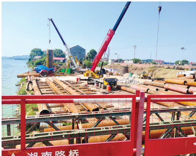
湖南路桥 醴陵高速湘江特大桥已开始桥墩基础施工。

醴陵高速株洲段,全长61.798公里,其中醴陵段里程46.369公里,渌口区里程14.84公里,天元区里程9.245公里,累计涉及征拆房屋7570余户,涉征房屋580余栋。 目前,渌口区现已累计签订47栋房屋54户,房屋面积约1.5万平方米(总房屋61栋);征拆房屋93394亩(总土地1037亩),完成房屋征拆任务的77%,土地任务的90%;醴陵市共完成542214亩土地征拆协议的签订,并完成腾地交地工作;天元区涉征的6个村已全部完成土地征拆协议的签订。 曾兴良介绍,尽管醴陵高速株洲段的征拆任务重,但沿线各区、市均克服困难、责任上肩,工作推动较为迅速,目前我市正在就项目征拆的相关适用政策、经费等制约性问题,与上级部门积极协调对接,推动包干协议的签订。 据了解,天元区、渌口区、醴陵市,已分别就项目的征拆工作进行动员准备,预计将于10月中旬全面推动征拆工作,为进一步推动醴陵高速的建设打开更大的工作局面。 起于茶陵孟塘止于衡阳常宁市的茶常高速公路,全长153.736公里,其中茶陵段20.437公里,应征地126.4407公顷,应拆除房屋58栋,目前正在土地征收。