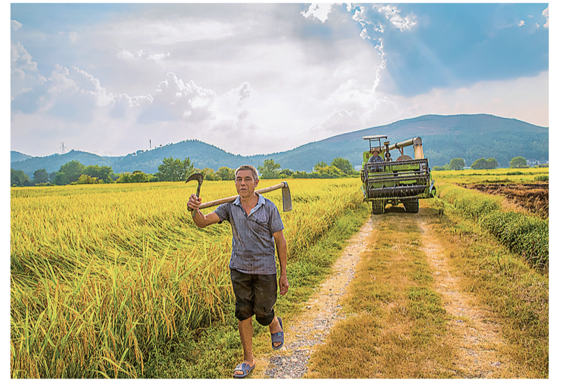
日头西斜,忙碌了一天的老农愉快地下班。