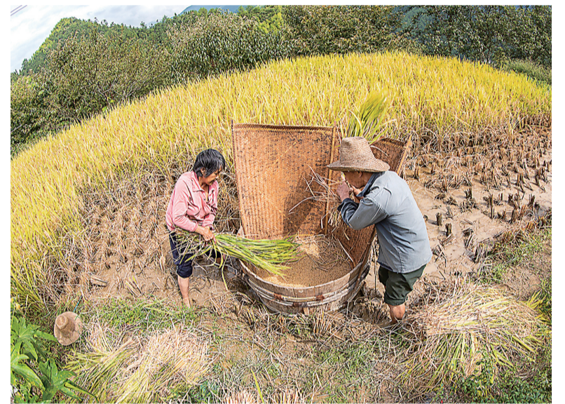
炎陵县,高海拔的小山村里,夫妇在收割稻子。