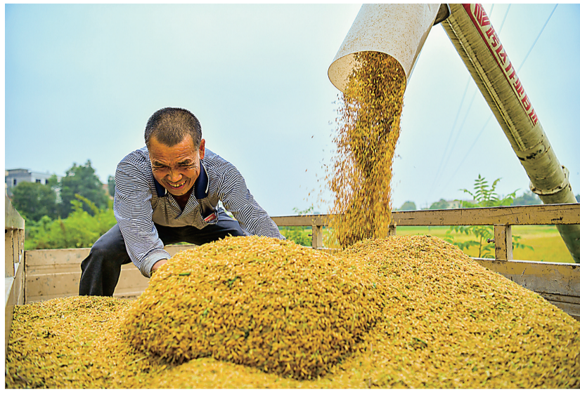
金色的收获,颗粒归仓。