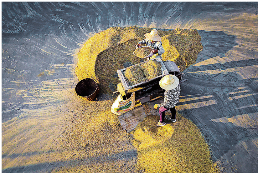
茶陵县虎踞镇,村民在忙着筛谷。