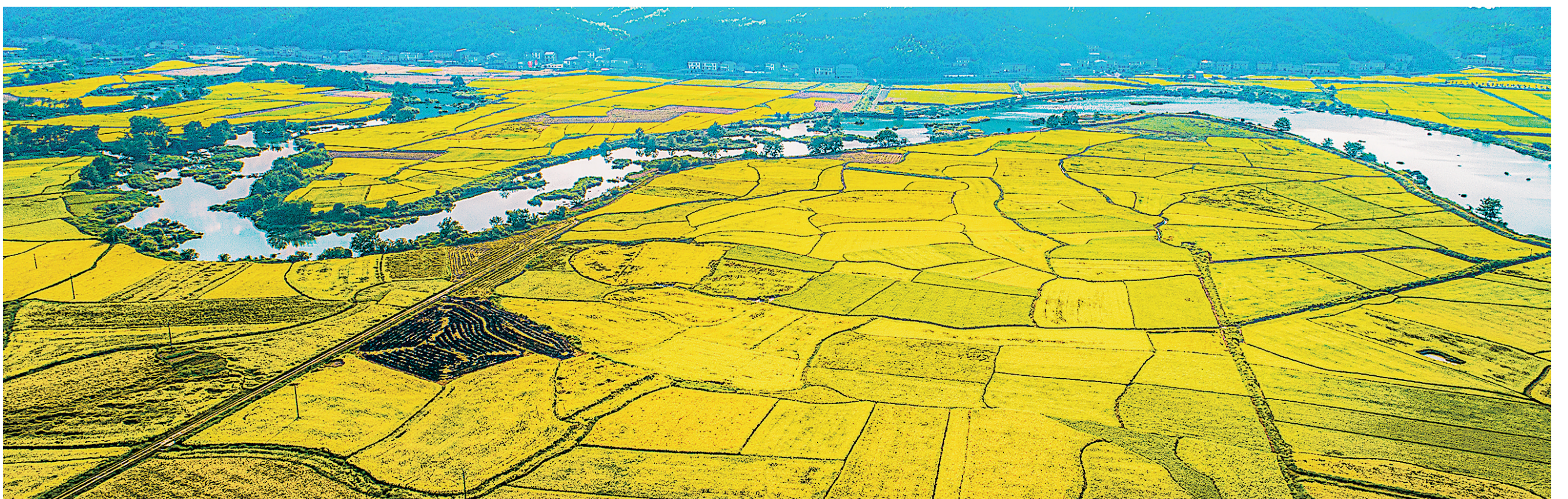
涿口区,金黄的大地,丰收的沃野。