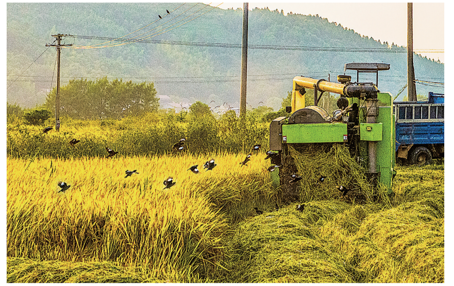
涿口区淦田镇,机器收割时,一群鸟儿追着啄食虫子。