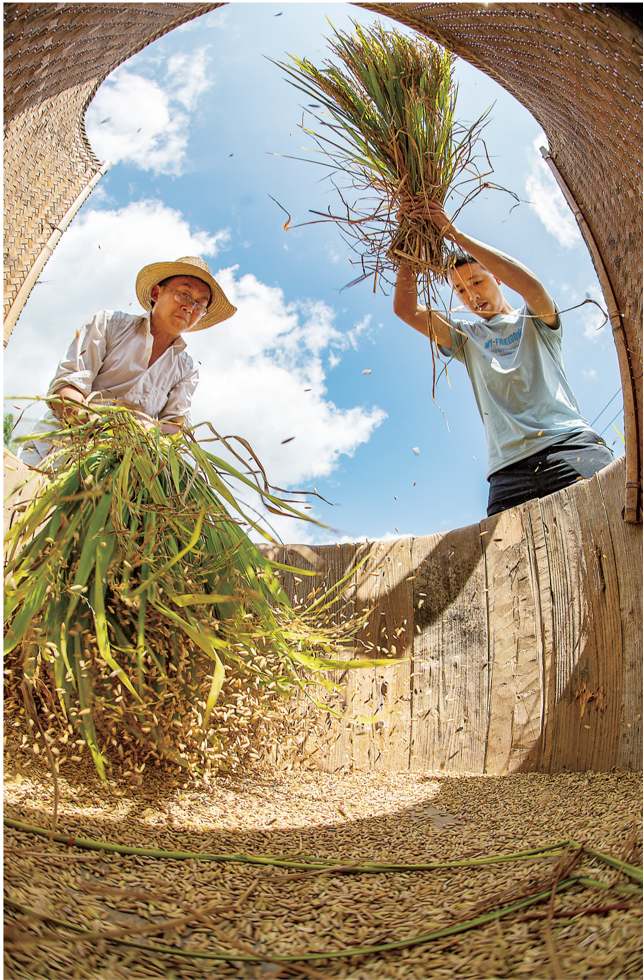
炎陵县策源乡,村民们还保持着纯手工的收割和打谷方式。

作为全国第一个建成制亩产过吨粮的地级市,株洲的粮食生产水平一直走在前列。据统计,今年全市共完成粮食生产面积337.6万亩,其中早稻95.4万亩,水稻生产全程机械化率达到82%,粮食丰收已成定局。