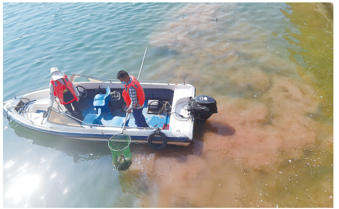
▲河道保洁人员在打捞垃圾。通讯员/供图