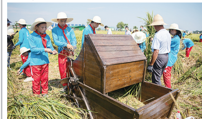
第四个中国农民丰收节前夕,习近平总书记代表党中央向全国广大农民和“三农”工作者致以节日的祝贺和诚挚的慰问。

9月23日,在长沙县路口镇隆平稻作公园,学生在体验操作手扶拖拉机。当日是中国农民丰收节,今年中国农民丰收节以“庆丰收、感党恩”为主题。