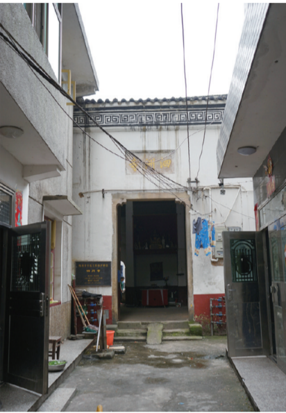
掩于民居中的泗州寺外景

按碑文所记，道光九年(1829年)的这次重建规模颇大，共计建屋十五间，前后后进，后栋供诸佛神像，前栋则供奉楚昭王神像，“初旧成也”。更重要的是，“寺之土木装饰，神之彩金壮丽”，皆“焕然一新”，显见彼时民众虔诚的数额不小，这也可以从另一块刻捐资者名姓及所捐钱款数目的碑文中瞧出端倪，统以千文为计量单位，多者至百千文，少者亦有五六千文，总有九百千文之多，按范文澜《中国通史》所引清朝档案，当时短工每天挣10文钱左右，最低每月130文钱，对比今日工价，当为一笔巨款。遗憾的是，历经岁月淘洗，当年重建的泗州寺，只余四壁萧然，“土木装饰”早已斑驳无存，“彩金壮丽”之神像亦不见踪影，现在的泗州寺前栋还保留有神龛，供奉着形制、大不一一的诸天神佛神像，多是左近信众捐赠而来，是否还存有当日重修时添置的神像，谁也不说清楚。 除了极尽铺排描摹重修后的寺观