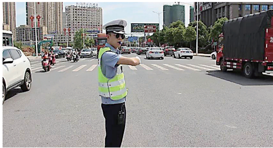
交警指挥疏导城乡交通。

为此,我市将紧盯客运班线车辆通行的集中时段、路段,组织执法小分队不定期的深入农村公路,进一步强化农村公路巡查管控力度,加大客运车辆违法行为查处力度,严防超员载客的隐患车辆上路行驶。