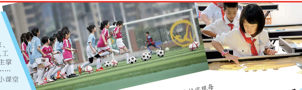
足球社团风靡校园 运动,从娃娃抓起,丰富的体育课程让学生们在校园里开展活动。天锻炼一小时的,图为市中二附二小足球社团开展活动。

“双减”政策下,不少学校通过科学研究,综合学生发展需要,将特色的课程更加丰富,“三点半课堂”焕发勃勃生机。