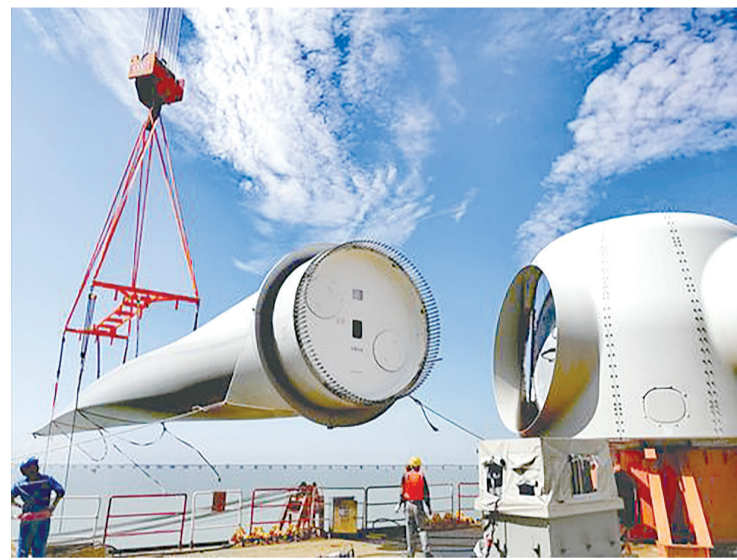
时代新材风电叶片产品