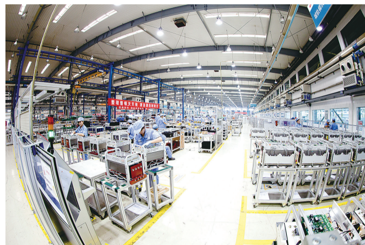
高铁核心部件制造车间