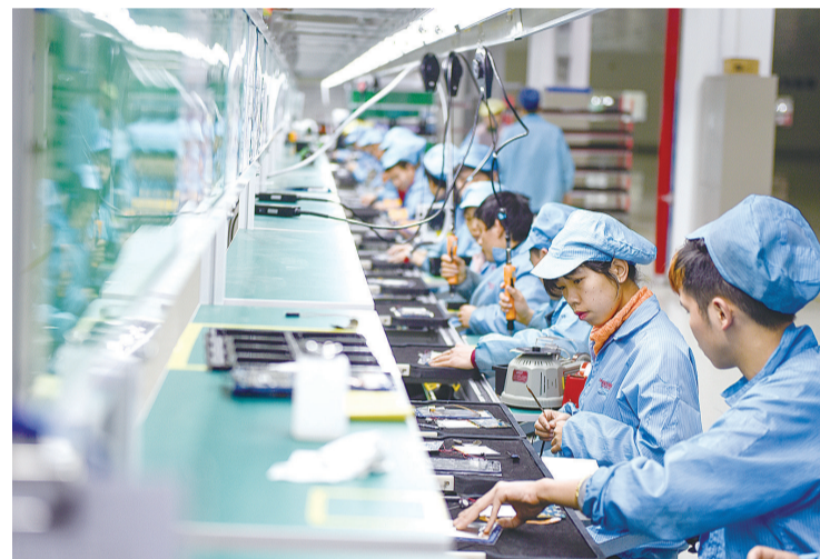
长城电脑智能基地生产线上,员工正在抓紧组装平板电脑