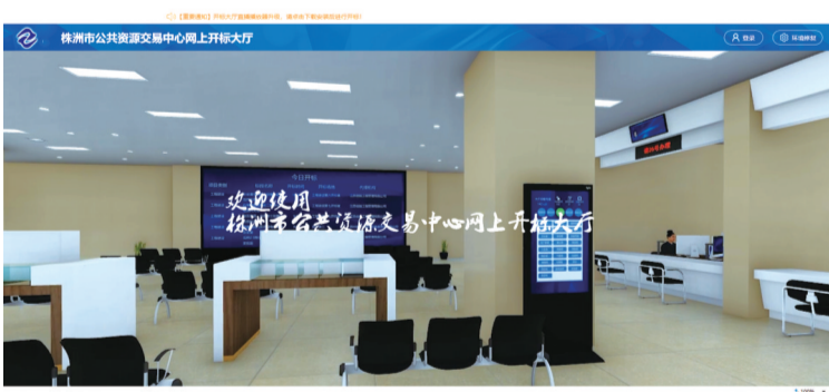
▲网上开标大厅截图。

在新冠疫情防控新常态下,市财政局紧抓政策机遇,力推政府采购信息化、智能化;市公共资源交易中心持续提升服务效能,致力改革创新,双方共同参与“不见面开标”系统开发建设及试运行,组织代理机构现场观摩和征求意见。 通过实践,“不见面开标”不仅方便了供应商,大幅降低投标成本,还能避免人员聚集,防止投标人信息泄露,减少围串标风险。“不见面开标”是我市继政府采购实施电子评标以来的又一重要举措。我市下一步还将大力推进政府采购远程异地评标、财政监管系统和公共资源交易系统对接等工作,以实现政府采购电子化全方位、全阶段、全覆盖。