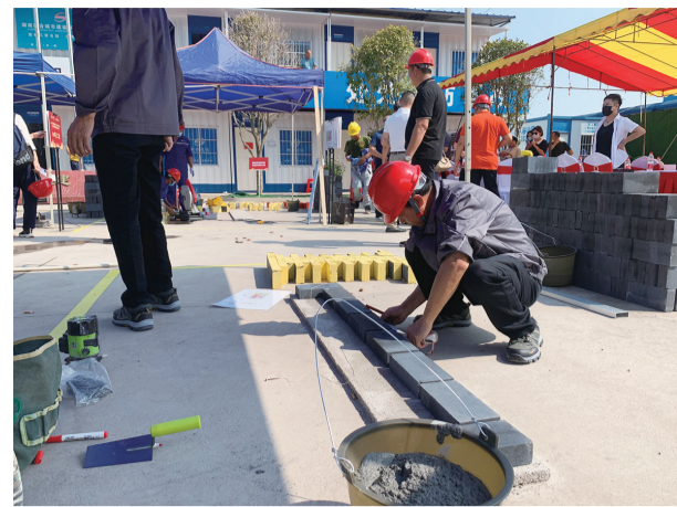
参赛选手全神贯注投入比赛。

株洲日报·掌上株洲讯(记者/吴楚 通讯员/李铁君) 全神贯注,干净利落,一块块砖被砌成规定墙体。9月12日,在石峰区恒和工贸·总部和大厦项目部,2021年株洲市砌筑工技能竞赛火热打响,“老师傅”们走上考场展开较量。