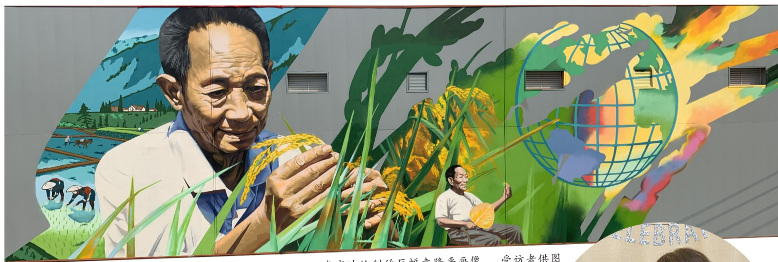
李宇冲绘制的巨幅袁隆平画像。

李宇冲绘制的主题就是袁隆平的“两个梦想”,一个是禾下乘凉梦,一个是杂交水稻覆盖世界梦。