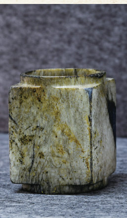
3号“祭祀坑”出土的刻有神树纹的玉琮。