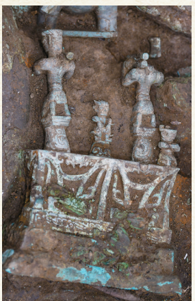
8号“祭祀坑”拍摄的青铜“神坛”局部。