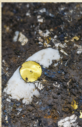
5号坑拍摄的金圆片