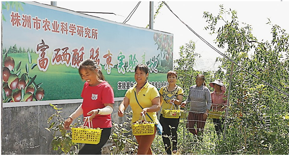
图为游客手提刚采摘的酥脆枣。