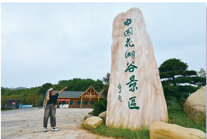
▲游客打卡“花湖谷”。