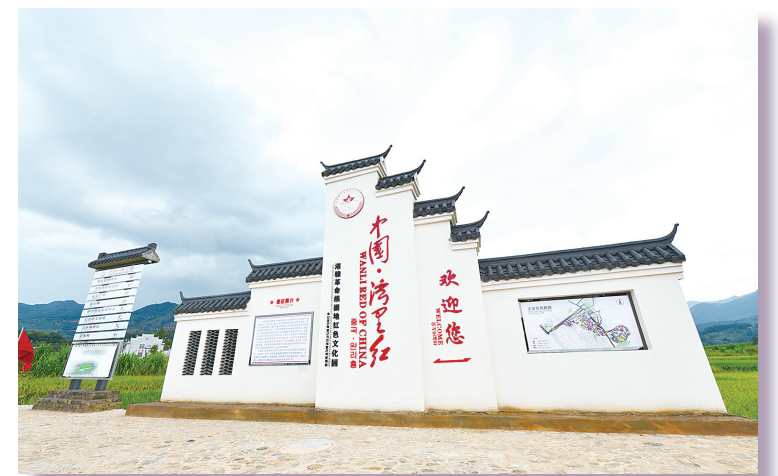
中国·湾里红湘赣革命根据地红色文化园牌坊。