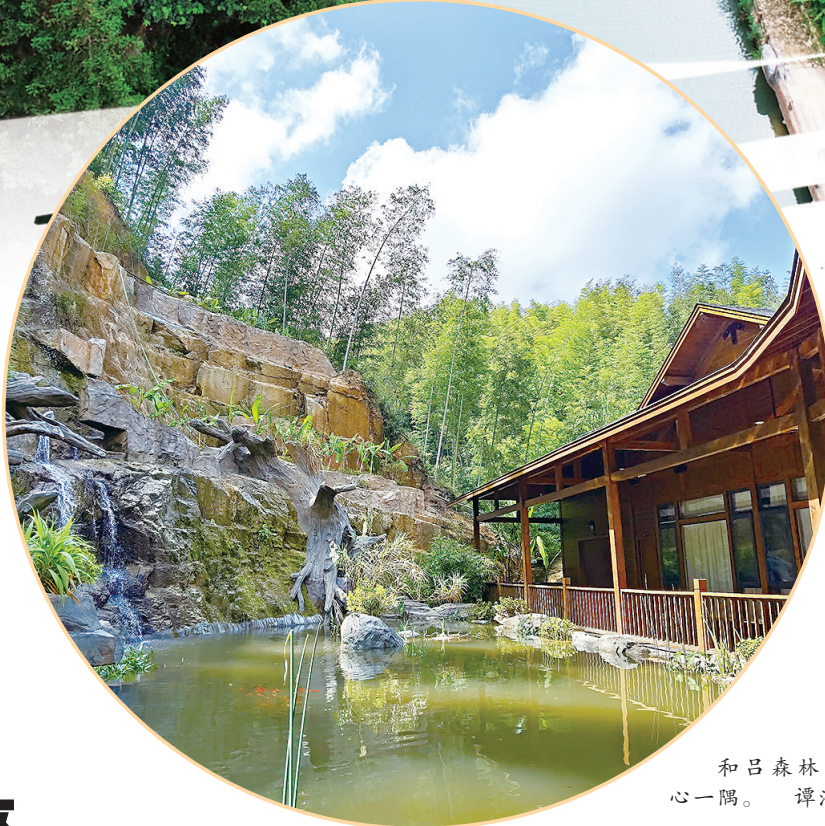
和吕森林康养中心一隅。