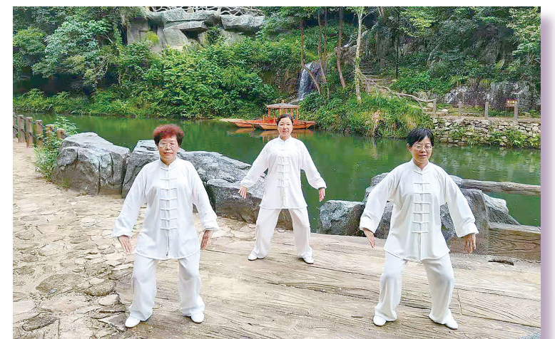
游客在和吕森林康养中心打太极。