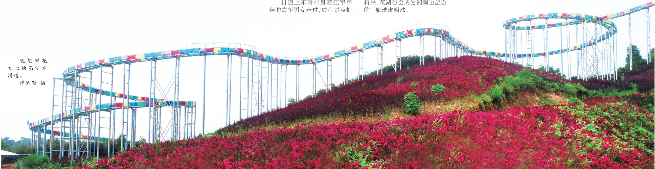
眺望鲜花之上的高空水滑道。

如今,正值建设湘赣边区域合作示范区的关健时期,茶陵县正努力完善设施,畅通S337省道,联通江西。我们相信,不久的将来,花湖谷会成为湘赣边旅游的一颗璀璨明珠。