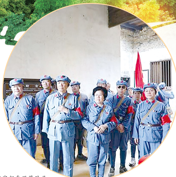
游客们参观茶陵县苏维埃政府旧址。