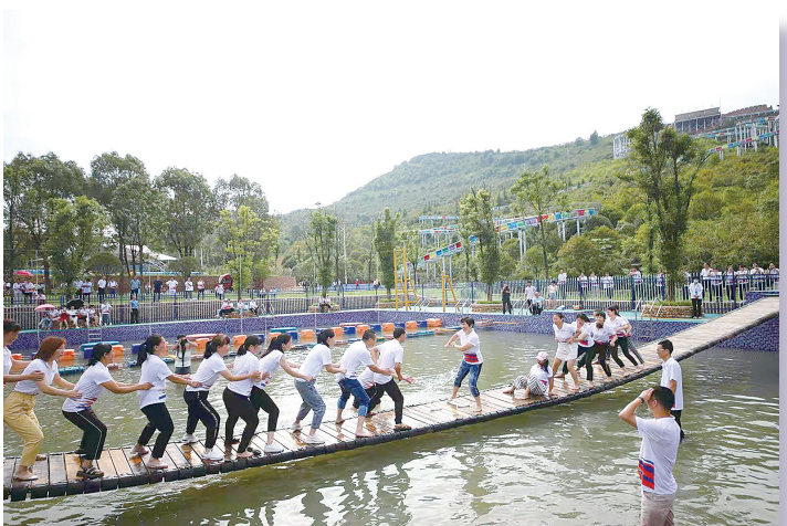
▲游客们游玩摇摆桥。