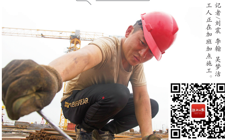
工人正在加班加点施工。