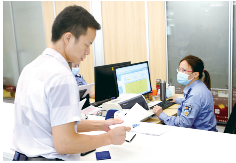
办事群众在交警窗口处理交通违法记录。