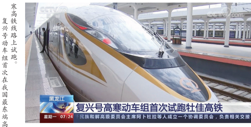
复兴号动车组首次在我国最东端高铁