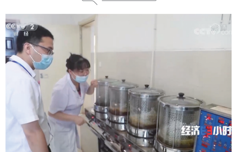
在株洲,医护人员为患者熬制中药。