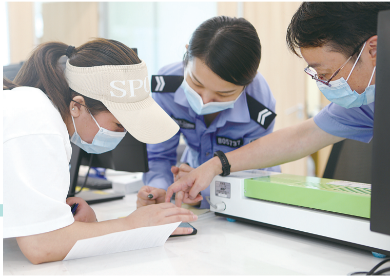
民警手把手指导办事群众安装使用“交管12123”App。

有在企业工作的青年人才反映交管业务叫号系统关闭时间太早,影响群众处理交通违法记录。也有群众反映,自己快下班时踩点前去办事,结果无功而返,只能下次再来。随到随办,让等候队伍短一点,成为广大驾驶员的共同呼声。