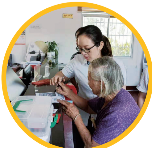
▲株洲珠江农商银行工作人员为老年人提供金融服务。