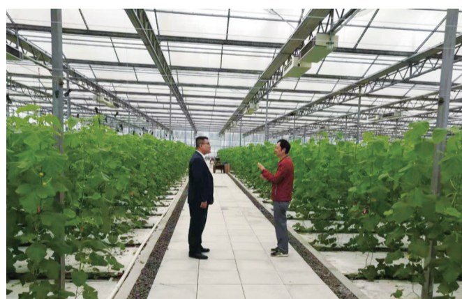
▲株洲珠江农商银行金融村官走访种植大户。

践行学史力行，成立青年先锋队，助力乡村振兴和“三高四新”战略。为响应溇口区党代会提出的“青春溇口，创业新城”，今年8月份，株洲珠江农商银行成立“80.90”青年先锋队，积极走访农户、小微企业，投身辖内普惠金融服务当中。