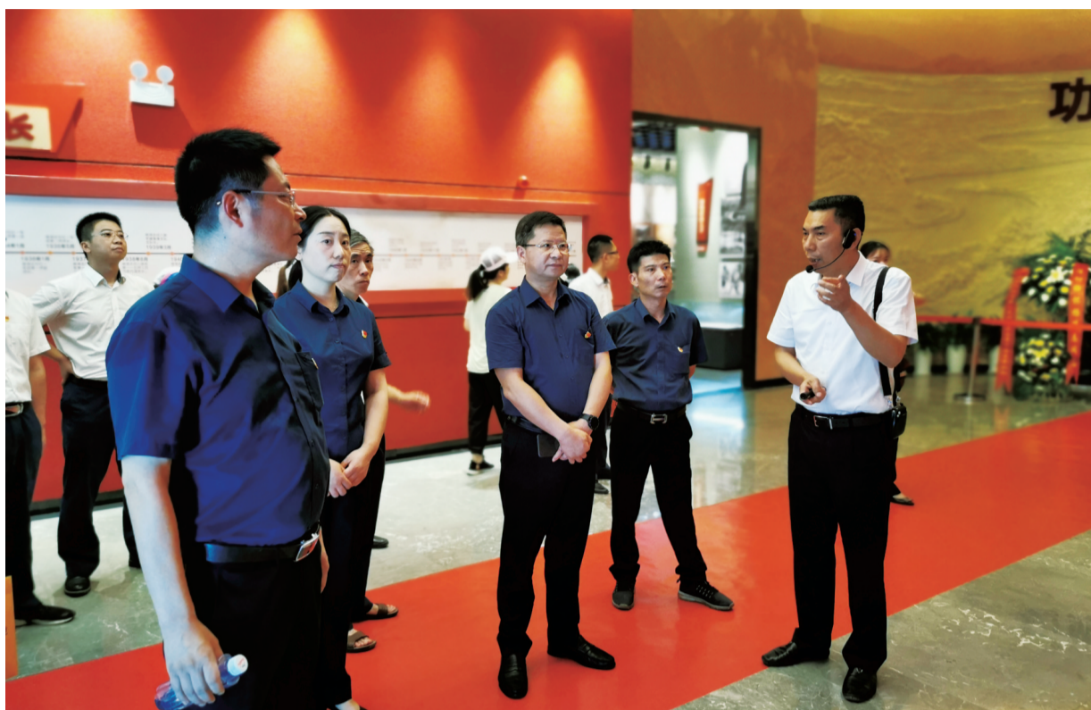
▲株洲珠江农商银行领导到溇口区博物馆开展党史学习教育。

截至2021年6月末，该行总资产超过100亿元，各项存款较2017年末增长29.21亿元，增幅51.98%；各项贷款较2017年末增长25.99亿元，增幅204.18%；存、贷款总量和市场份额在株洲市辖内10家金融机构中均居前列。改制后缴纳各项税费1.02亿元，向株洲市教育基金会和帮扶村等组织和个人捐助104万元。2020年度央行评级为A级；监管评级为3B，较改制前提升6个等级。2020年荣获株洲市“奋战一百天、冲刺双过半”金融信贷促发展活动“先进单位”称号和“促进经济社会发展工作信贷服务奖”，以及株洲市“财税贡献奖”“信贷服务奖”，并先后被评为区、市、省级文明单位。