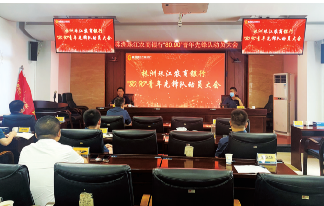
▲株洲珠江农商银行青年先锋队动员大会。