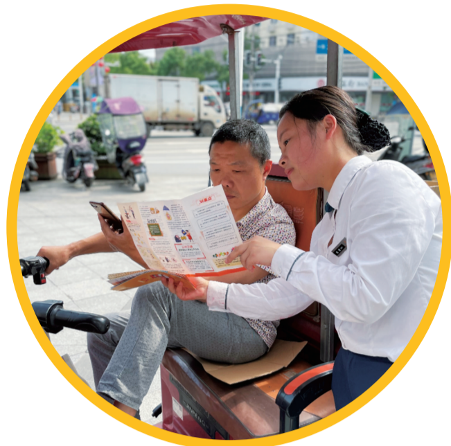
▲株洲珠江农商银行工作人员反电信诈骗宣传。