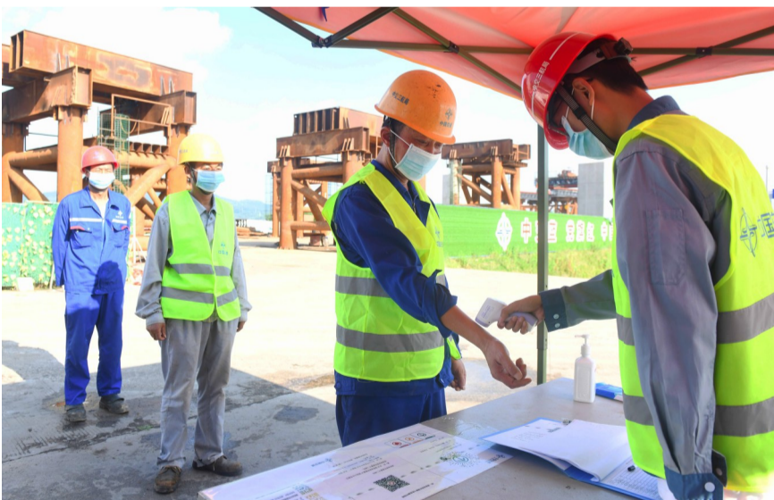
进入工地前,工人师傅要经过严格的体温测量。