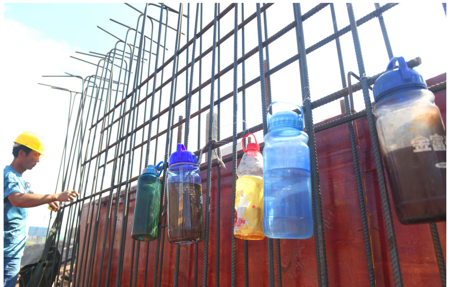
高温下作业需要及时补充水分。