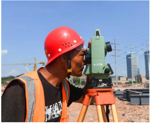
晒得黝黑的测量师顶着烈日坚持工作。

八月,我市持续高温。各民生重点工程施工项目在做好防疫防暑工作的同时,积极推进生产建设。