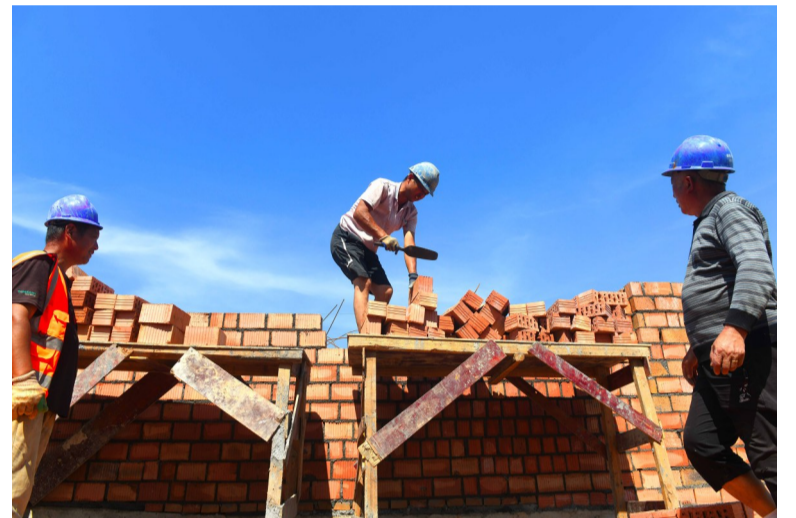
泥工师傅们在长沙市一中株洲实验学校砌建外墙。