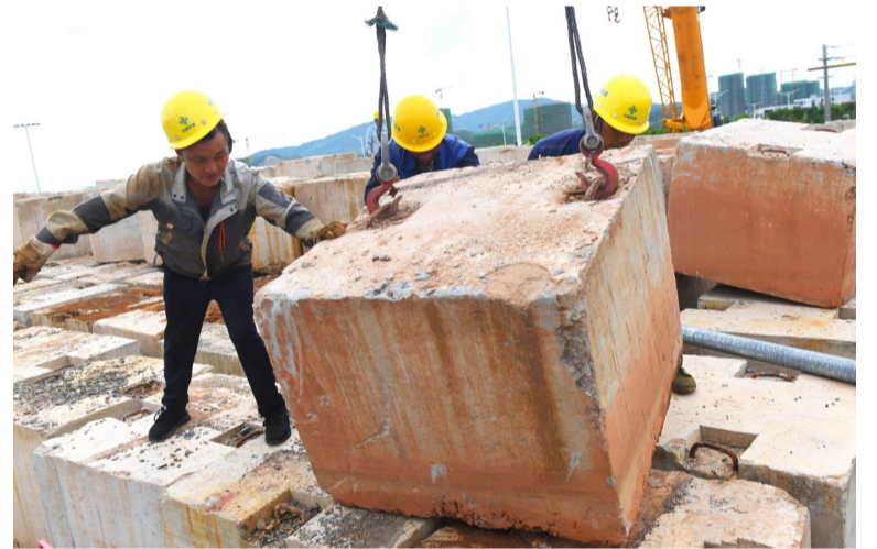
清水塘大桥引桥施工段,工人师傅在配合机械吊装预压块。