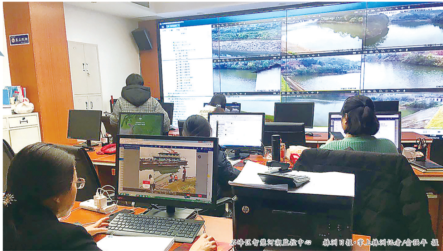
石峰区智慧河湖监控中心

如今,这里已从烟尘蔽日,到蓝天白云;从超标排放,到空气清新;从江水浑浊,到碧波荡漾;从粗放发展,到生态崛起……株洲获评“全国水生态文明城市”“中国绿水青山典范城市”。