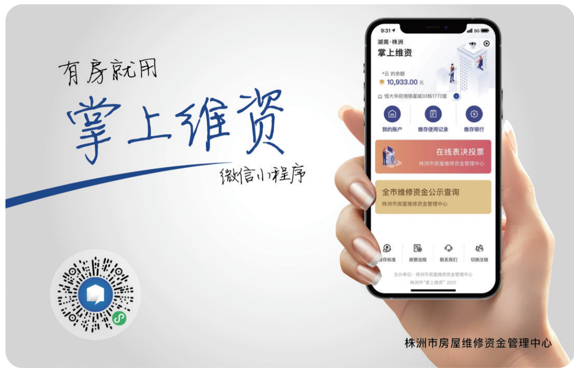
株洲市房屋维修资金管理中心