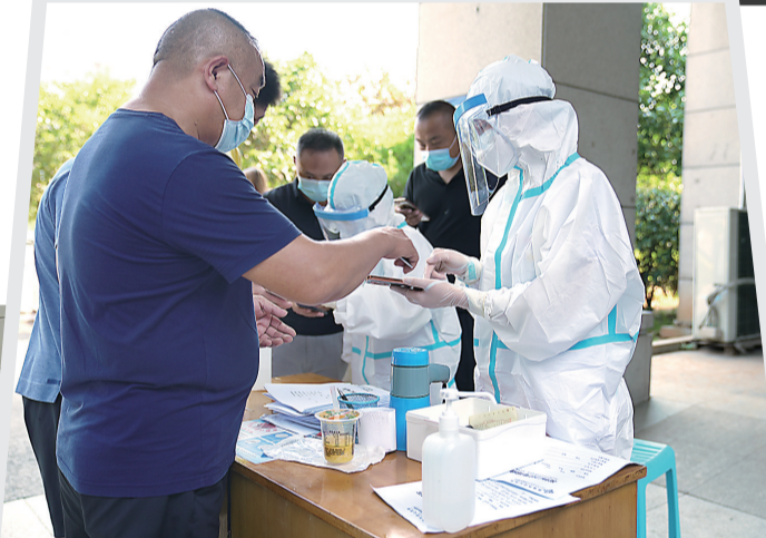
市中心医院严把预检分诊关口,医护人员仔细查验就诊者的“两码”。