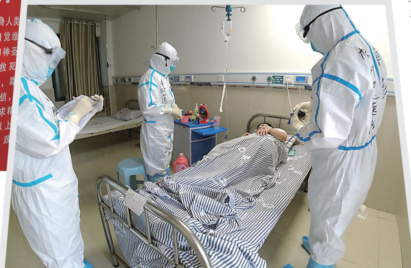
市中心医院的医护人员正在隔离病房查房。