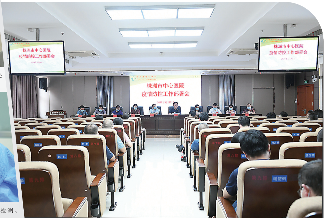
市中心医院召开疫情防控工作部署会。