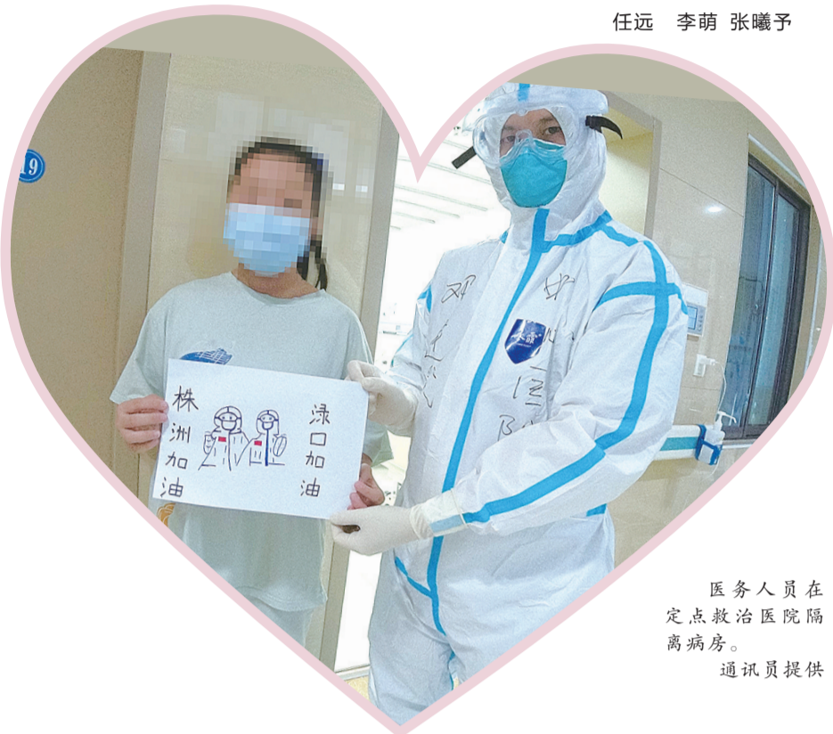
医务人员 在 定点救治医院隔 离病房。