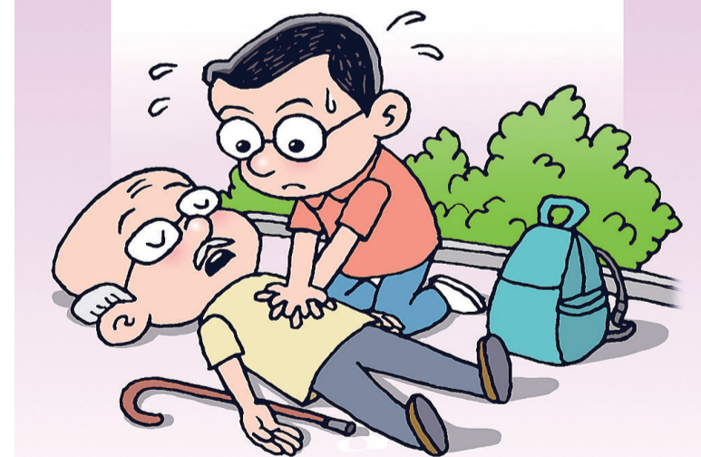
漫画:予以免责 新华社发 徐晓作

新华社北京8月17日电 17日提请十三届全国人大常委会第三十次会议审议的医师法草案三审稿,拟明确医师自愿参与公共场所救治予以免责。