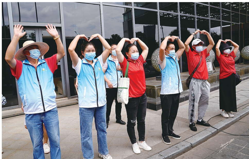
8月12日,欢送现场,市民双手比心感谢医疗队。

抗疫期间,衡阳医疗队不断优化核酸采集流程,获得了株洲市民的普遍好评,医护人员李胖每天采集前,将十根采集棉签捆成一束,“十人混检的技术有时候怕弄混标本,所以我们实操中也摸索了经验,棉签用完就是下一个标本管了。”这为居民的信息核对上了双保险。