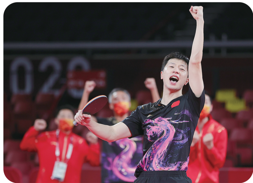
马龙击败德国队球员波尔后庆祝。

本报综合消息 8月6日晚，中国男乒在男团决赛中3:0击败年龄相加超过100岁的老对手德国队，连续第四次问鼎奥运会乒乓球男团冠军。 至此，中国乒乓球队在东京体育馆收获了全部5枚奥运乒乓球金牌中除混双外的4枚，外加混双和男、女单打的3枚银牌。 过去三届奥运会的男团比赛中，中国队有两次遭遇德国。2008年“二王一马”时代的中国男乒就以3:0战胜德国，夺得北京奥运会金牌，当时对方阵容便以波尔领衔，未满20岁的奥恰洛夫在列；2012年伦敦奥运会上，马龙、张继科和王皓又于半决赛3:1淘汰德国。 十三年过去，中国男乒阵容换了一轮半，德国却还是奥恰洛夫和波尔打一、二号位置。 在中德双方1991年迄今的15次交手记录中，中国队以15:0的胜率占据绝对优势，唯一一次打到3:2还是在30年前，其余均为四局内获胜。 赛后，马龙坦言落后时，并没有让心态动摇：“还是重新再来吧，过往的经历也有被波尔缠住，被逆转的，相信自己的同伴，更相信自己，技战术方面还是从头再来，毕竟大比分还是领先。” 被记者问勇夺男单和男团双冠的感受，马龙谦虚回应说：“真没有想太多，夺冠这一刻会很开心，但其实也就那样吧，这是人生重要的经历但不是人生的全部，还是希望自己能够踏踏实实。”