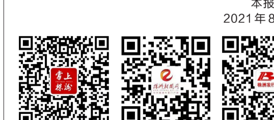
掌上株洲 App 株洲新闻网 株洲发行 手机版 公众号

欢迎大家关注“掌上株洲”App、“株洲新闻网”(https://www.zznews.gov.cn)和“株洲发行”微信公众号,查看每天的数字报,了解最新防疫动态及更多新闻资讯。