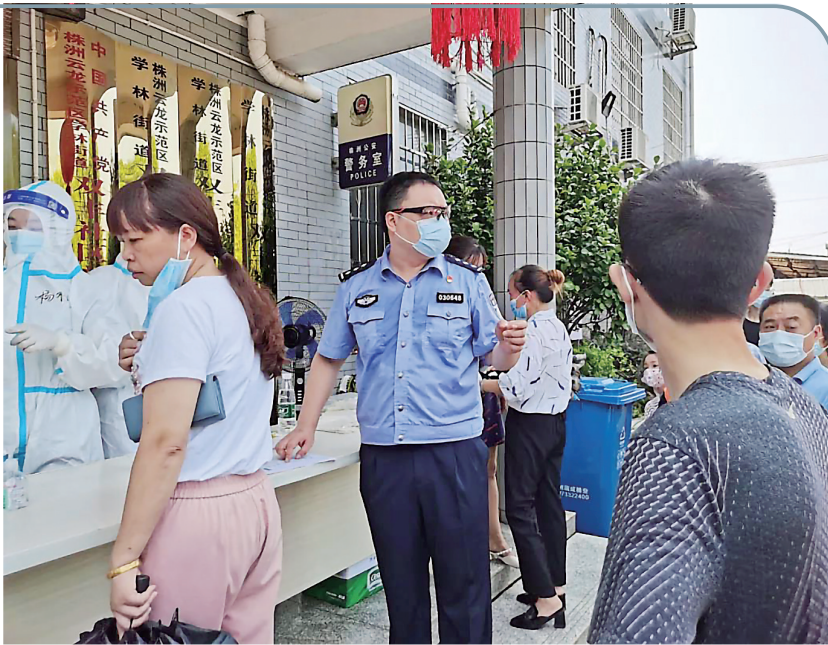
公安民警坚守核酸检测点,警服被汗水湿透。通讯员 供图

抗击疫情,冲锋在前。自我市疫情发生以来,市公安局党委高度重视,火速出动1532名警力,组建工作专班开展疫情防控流行病学调查(简称“流调”)工作。