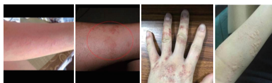
▲省直中医医院皮肤科门诊已经接诊了许多皮肤过敏患者。

三伏天以来,省直中医医院皮肤科门诊已经接诊了许多皮肤过敏患者,他们大多都是因为吃伏鸡伏狗或是羊肉而发一身疹子。