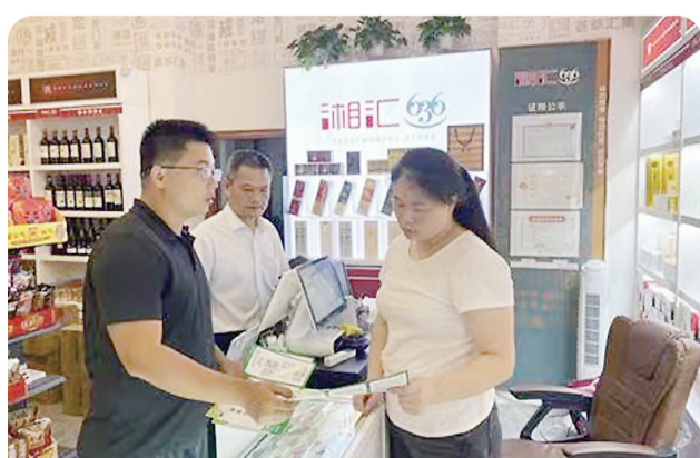
市烟草专卖局入户普法宣传。