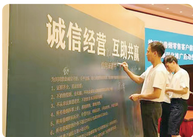
零售客户代表诚信经营承诺签名。