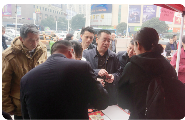
市烟草专卖局主要负责人在“3·15”现场开展法律法规宣传。

同时,针对内部职工,该局以聘请专家授课、法治论坛和普法法法考试等方式,提高干部职工法律素养。期间,该局共组织党组中心组学法36次,开展法治培训50余场次,开展民法典、“不得向未成年人销售卷烟”等专题普法3次,举办法治讲堂40余场次。此外,以“6·29”、“12·4”等法治宣传日为契机,多载体、多形式宣传烟草专卖相关法律法规和未成年人保护法,提升社会公众对烟草专卖管理的认知。近年来,该局共开展法治宣传62场次,印发宣传资料18000余份,接待咨询人次8000余人次,开展“法律六进”活动20余次,使法治思维深入人心、深得人心。