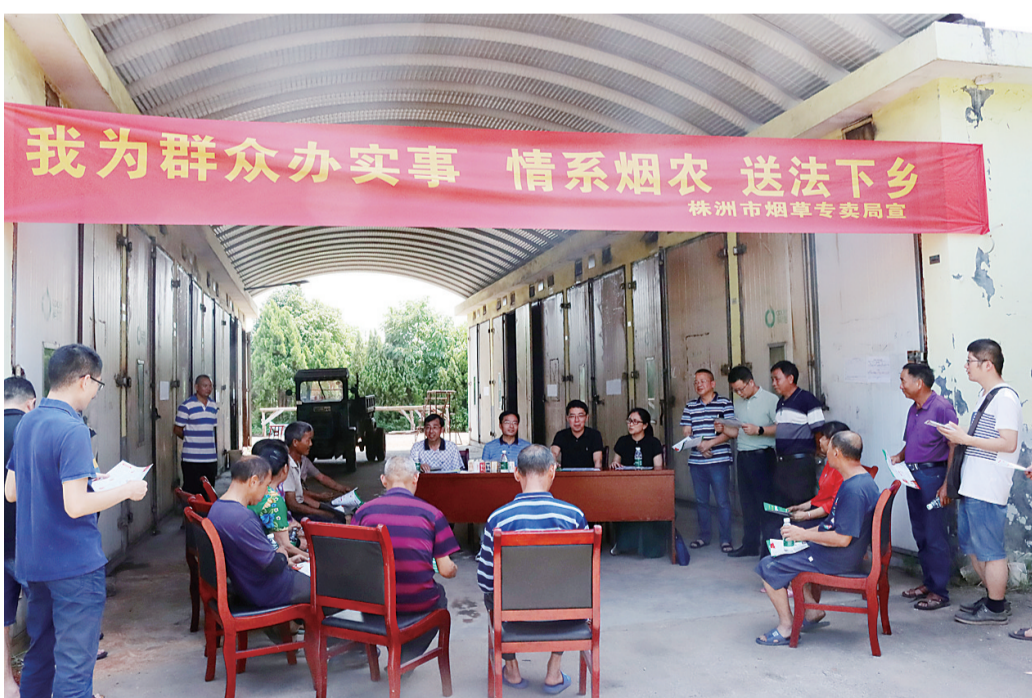
市烟草专卖局工作人员送法下乡。

将考核当作指挥棒。市烟草专卖局成立由主要负责人任组长的“七五”普法领导小组,每年召开专题会议,研究部署全市系统普法工作,在全市系统开展普法依法治理考核,将普法工作转化为可量化考核的“硬指标”,确保“七五”普法规划按时、按质推进。