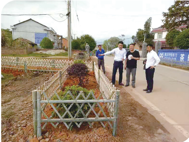
人居环境工作人员在洲陂村现场督查。