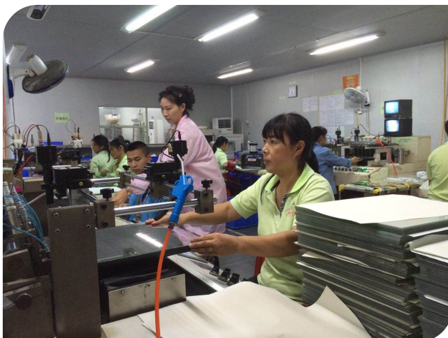
晶彩电子员工专注生产