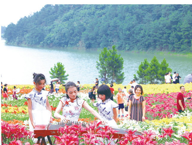
游客畅玩茶乡花海