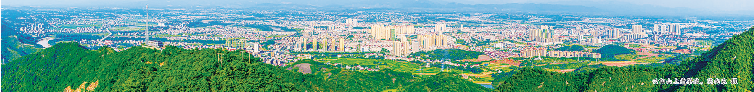
云阳山上俯瞰茶陵。

5年来,茶陵始终坚持“政治统领、强基固本、正风肃纪”并行,党的建设全面加强。认真开展“两学一做”学习教育、“不忘初心、牢记使命”主题教育和党史学习教育,党员干部政治素养不断提升。扎实推进“组织力提升工程”,整顿提升143个软弱涣散党组织,全县885个党支部均达到“五化”标准,圆满完成村(社区)“两委”换届选举,实现村干部整体学历上升、年龄下降、老中青梯次配备。坚持“凭实绩、凭能力、凭品德、凭口碑”用干部,始终保持反腐败高压态势,坚定稳妥推动巡察工作深化发展,2016年以来共立案985件,处分928人,2020年扶贫领域腐败和作风问题专项治理考核名列湖南省贫困县考核一类,有力净化了政治生态。