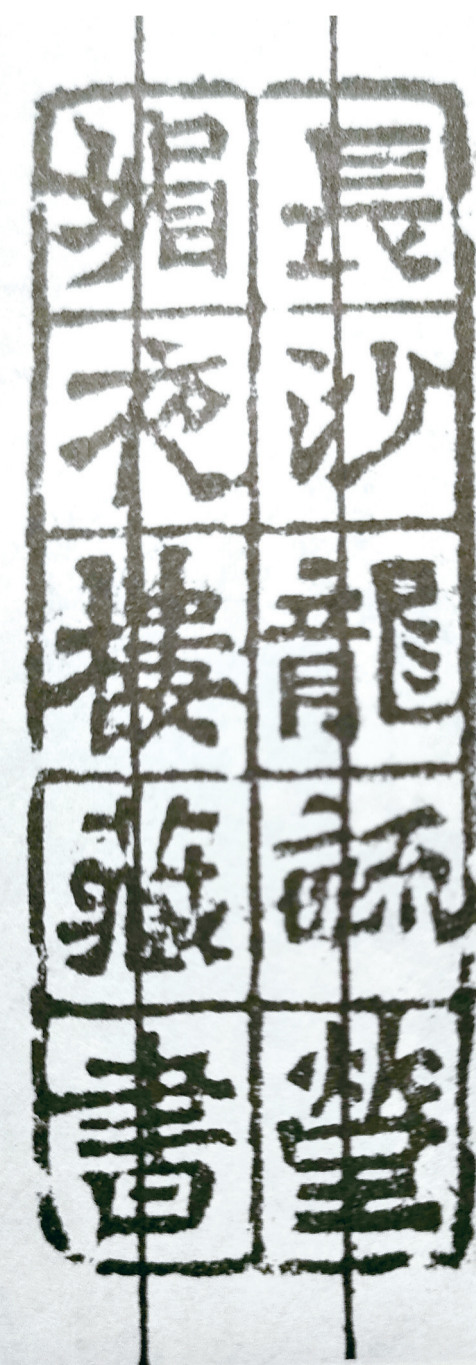
龙伯坚(名毓莹,伯坚其字也)藏书印

攸县横山龙氏家族曾有这三幅字:一幅是中国革命之父孙中山先生题的“博爱”,一幅是革命先驱黄兴写的“无我”,一幅是伟大领袖毛泽东的手记。