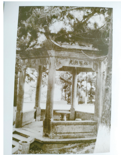
衡山上龙珠的纪念亭——烈光亭