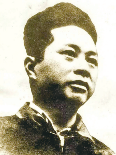
时任独立团团长的叶挺。