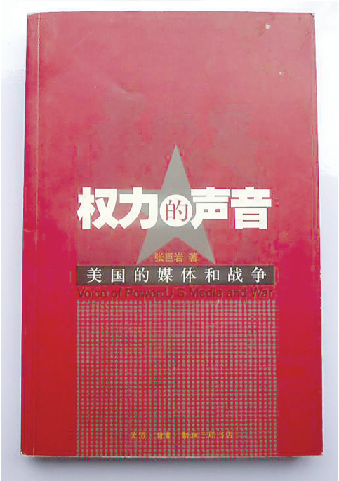
《权力的声音:美国的媒体和战争》