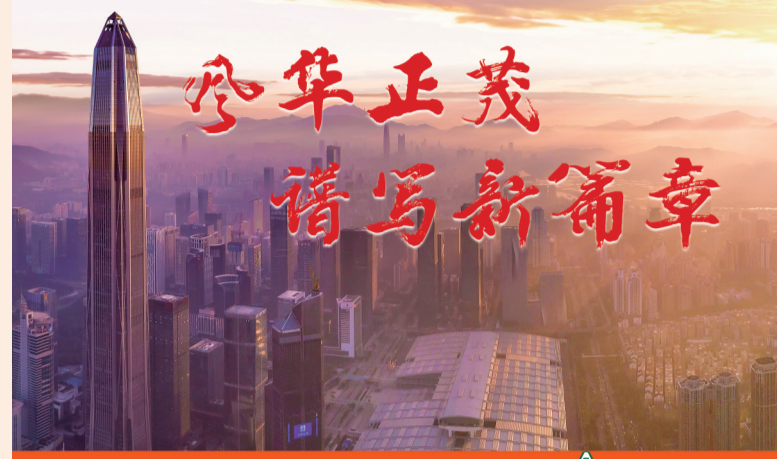
中国平安坚持于实体经济，在党的坚强领导下，从国内第一支股份制保险总司成立成长为全球领先的综合金融集团，中国平安始终以客户利益为出发点，科技赋能，全方位支持实体经济，全面投入乡村振兴建设，为实现中华民族伟大复兴贡献力量。

近年来，平安人寿在服务实体经济、助力扶贫、公益活动等多个方面展开行动，努力在这个伟大时代贡献自己的力量，交出一份砥砺奋进的答卷。