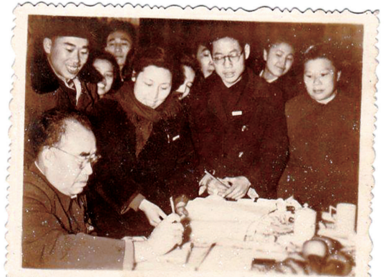
1959年3月1日，时任国家副主席朱德在株洲苧麻纺织厂视察时为大家题词。